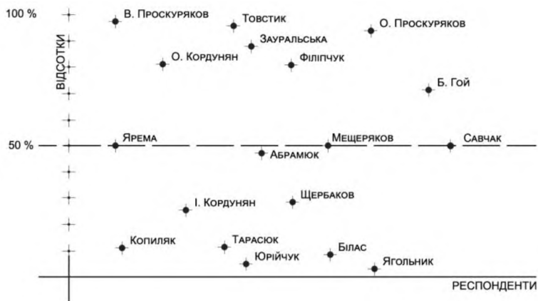
Рис.2 Відсоток громадських будівель і зокрема театральньо-видовищних у творчому проектуванні і будівництві респондентів

Але є багато архітекторів, в яких цей відсоток значний: Д. Ярема – 50%, Б. Гой – 70-80%, Віктор та Олексій Проскураєкові зі Львова - 100%, В. Мещеряков з Одеси і І. Абрамюк з Луцька – до 50%, О. Кордунян з Чернівців і Ю. Філіпчук з Червонограда – по 80%, Т. Товстик з Дніпра – 100% та ін. (рис. 2).