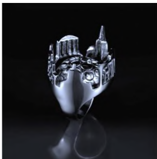
Рис.2 Агнешка Максимюк, перстень «Бірмінгем»