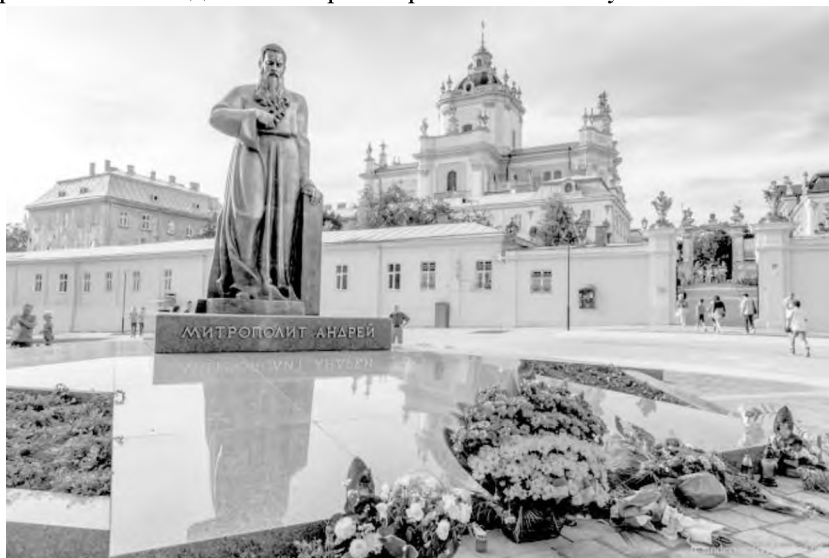
Рис.3 Пам'ятник Митрополитові Шептицькому

за часів незалежності України стала побудова в центрі міста на проспекті Свободи пам'ятника Тарасові Шевченку.