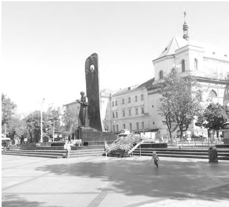
Рис.4 Пам'ятник Тарасові Шевченку на проспекті Свободи

Дуже виразними місцями пам'яті, а також і громадськими просторами є місця пов'язані з двома Світовими війнами які прокотилися через Львів. Основним об'єктом тут є Личаківський цвинтар. Цвинтар існує з 1786 року. Під час Першої світової війни на північній околиці цвинтаря постав військовий цвинтар вояків австрійської армії і союзників що полягли у Першій світовій війні. Серед похованих були німці, українці, поляки, серби, чехи, боснійці. В іншій частині цвинтаря були поховані полегли учасники боїв проти ЗУНР (1918–1919) та проти більшовиків. 1921 року було організовано конкурс проєктів некрополя. А у 1926–1939 рр. споруджено «Меморіал орлят» польські військові поховання [8].