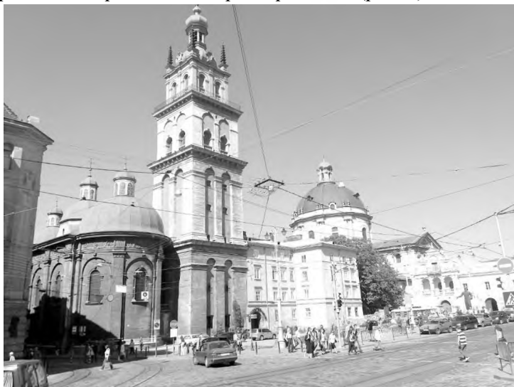
Рис.2 Ансамбль Успенської церкви та пам'ятник І. Федорову

вірменською та єврейською. Архітектурне обличчя кожної з громад найяскравіше проявилось в культовій споруді, яка довгий час була центром громадського простору кожної з дільниць. Український квартал ознакований Успенською церквою ансамбль якої включає власне церкву, вежу дзвіниці та каплицю. Це найцікавіша пам'ятка львівського ренесансу, споруджена в 1591-1629 рр. на замовлення Львівського ставропігійного братства. Братство організувало у Львові шпиталь — притулок для непрацездатних, мало друкарню, школу, вело власну бібліотеку [2]. Неподалік від місця, де в 16-му столітті знаходилася друкарня Львівського ставропігійного братства на майданчику, що утворився після впорядкування скверу в підніжжі вежі-дзвіниці між входами до Успенської церкви та Державного архіву Львівської області, а також вулицями Підвальною та Руською у 1977 році було споруджено пам'ятник Іванові Фєдорову – першодрукареві. Під час побудови пам'ятника було відкрито та заекспоновано частину оборонних мурів Львова власне вздовж вулиці Підвальної [3]. Площа навколо пам'ятника — найбільший букіністичний ринок Львова – один з найбільш жвавих і запотребованих громадських просторів міста (рис 2).