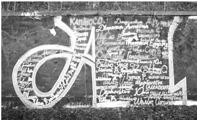
Рис. 6, Літери напису «Небесна Сотня»

Зі сторони вул. Вітовського вхід до парку оформлено оригінальною колонадою. Пізніше, але ще в радянські часи, на площі перед входом споруджено великі фонтани. Напроти входу в парк на другому боці вулиці розбито травник який опирається в гору цитадель і завершується підпірною стінкою з бетонних плит. На початку 90-х років на травнику з'являється символічний камінь з написом «борцям за волю України». Так цей камінь і простояв майже 20 років. А на стіні позаду каменя почали малювати графіті – різного змісту і якості. Влада пробувала впорядкувати цей процес, але це не завжди вдавалося. Після розстрілу майдану 24 лютого 2014 року дуже спонтанно і дуже швидко на стіні з'явився напис величезними буквами на цілу стіну «небесна сотня». Напис був виконаний українським шрифтом «Нарбут» у синьо-жовтих кольорах на чорному тлі. У кожній літері близько 40 прізвищ. Рис.6,7. Львівські райтери стверджують, що ідея в тому, щоб хоча б таким чином віддати шану Героям.