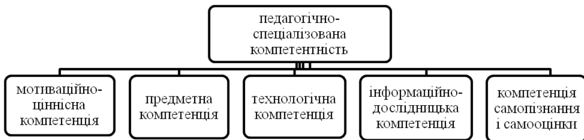
Рис. 1. Змістова структура педагогічно-спеціалізованої компетентності майбутніх учителів здійснювати професійну діяльність в умовах варіативності освітньо-виховних систем.

Мотиваційно-ціннісна компетентність включає сформованість у майбутніх учителів професійних і особистих інтересів та потреб, позитивної мотивації у виборі професійної діяльності, ціннісних орієнтацій навчання, пов'язаних з розумінням особливостей майбутньої професійної діяльності в різних освітньо-виховних системах, осмислення ролі й призначення вчителя в суспільстві, уміння вибирати цільові і змістові установки своїх дій і вчинків для формування власної професійної стратегії й вдосконалення своїх професійних якостей.