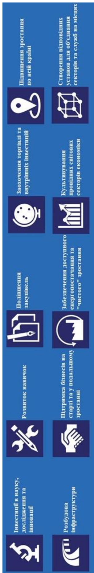
Інфографіка 1: Десять основних елементів розвитку промисловості Великої Британії