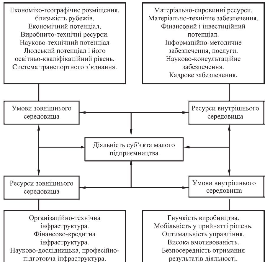
Рис. 1. Чинники розвитку суб'єктів малого підприємництва в регіоні

Що стосується окремих складових індексу конкурентоспроможності, рівень розвитку інституцій в регіонах України традиційно є стримуючим фактором для зростання конкурентоспроможності, особливо це актуально для лідерів рейтингу. Наприклад, Київ третій рік за-