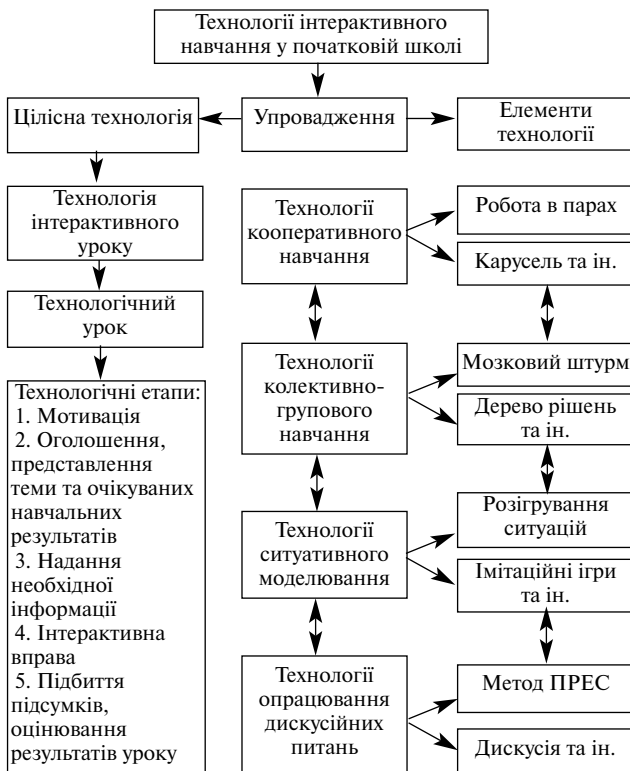
Рис. 1. Модель упровадження технологій інтерактивного навчання.

Модель упровадження технологій інтерактивного навчання така (Рис.1).