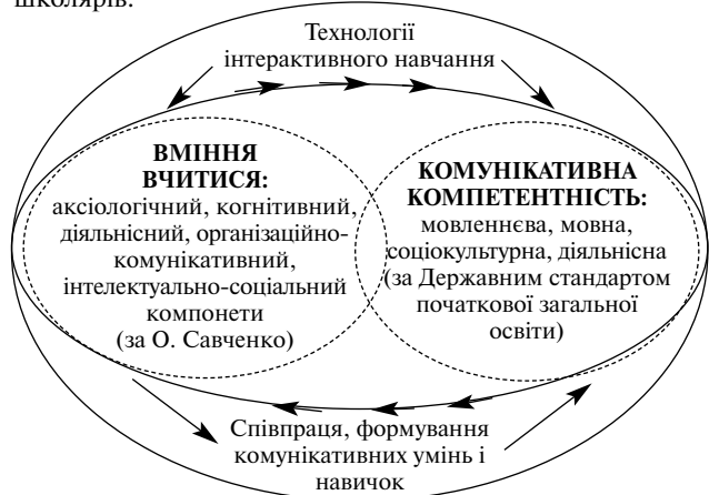
Рис. 2. Модель реалізації провідної ідеї досвіду

навчання з традиційними формами, методами та прийомами роботи з розвитку зв'язного мовлення молодших школярів.