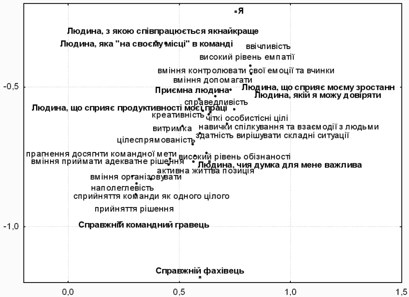
Рис. 2. Фрагмент рефлексивного ціннісно-рольового простору імпліцитної теорії досліджуваного студента

На рис. 2. візуалізовано фрагмент імпліцитної теорії досліджуваного. Перший фактор позитивно зв'язаний із ролями Людина, що не здатна бути лідером команди (1,19) та Людина, яка не на своєму місці в команді (1,1); також на цьому полюсі з менш тісним зв'язком знаходиться елемент Я (0,75) та всі інші ролі позитивної семантики. Протилежний полюс фактору пов'язаний із ролями, що інгібують діяльність та особистісне зростання: Людина, конструктивна співпраця з якою не можлива (1,34); Людина, що заважає мені працювати (-1,69); Людина, якій довіряти не можна (-1,03); Неприємна людина (-2,08); Людина, що гальмує моє особистісне зростання (-1,26). У ціннісному змісті фактору відбито своєрідне морально-нормативне протиставлення, за якого етична поведінка, зокрема справедливість (0,75), високий рівень емпатії (0,82), навички спілкування та взаємодії з людьми (0,72), вміння контролювати