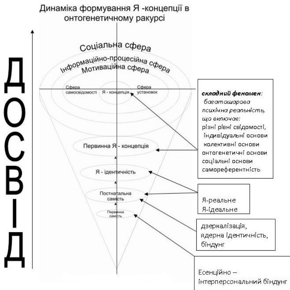
Рис. 1. Динамічна модель формування Я-концепції в онтогенетичному ракурсі

Обґрунтовано те, що якість ранньої прив'язаності між мамою та немовлям, задоволення базових дитячих его-потреб у дзеркалізації, ідеалізації (впевненості у всемогутності матері) та альтер-его (відчуття схожості з матір'ю), творить основу для формування первинного Я-образу та ядрової ідентичності та в подальшому Я-концепції (а їх порушення спричиняє порушення психічної інтеграції, що проявляється насамперед у нарцисичній психопатології) [9], [14], [15], [17].