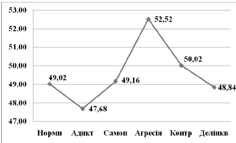
Рис. 2. Результати аналізу схильності підлітків до девіантної поведінки

При аналізі особливостей схильності підлітків до девіантної поведінки виявлено, що найбільш вираженою є схильність підлітків до агресії та насилля, тоді як найменш вираженою є схильність до адиктивної поведінки (рис. 2).