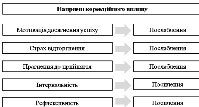
Рис. 1. Напрями корекції соціально-психологічних особливостей стилю споживання матеріальних благ особами з низьким економічним статусом

Слід зазначити, що не всі перераховані вище негативні прояви соціально-психологічних особливостей стилю споживання матеріальних благ властиві особам, що мають низький економічний статус, що певним чином ускладнює створення єдиної корекційної програми для носіїв низького економічного статусу. Крім того, ми вважаємо, що не всі негативні прояви соціально-психологічних особливостей стилю споживання матеріальних благ здатні піддатись корекції в рамках невеликої серії корекційних занять, адже для їхнього подолання потрібна більш глибока як тренінгова, так і психотерапевтична робота. До таких особливостей належать, зокрема, ціннісні компоненти, а також локус контролю, який є базовою психологічною настановою особистості щодо привласнення або відчуження відповідальності за власне життя. Тому ми сфокусувались на обґрунтуванні можливостей корекційного впливу, не прагнучі досягти корекції всіх означених негативних проявів соціально-психологічних особливостей стилю споживання матеріальних благ особами з низьким економічним статусом.