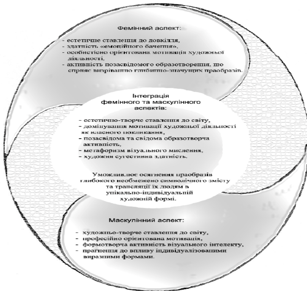
Рис. 1. Інтеграція фемінного та маскулінного змістовлень у структурі художньо обдарованої особистості

Механізм художньої проєкції вмикається через канал зростання внутрішнього напруження до болісного дискомфортного рівня, тобто як переживання «важкості недоброї» і втамування потреби звільнитися від неї. Функціонування фемінного та маскулінного аспектів у творчому циклі художньо обдарованої особистості відображено на рис. 2 .