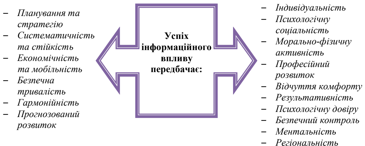
Рис. 3. Оргтехнологічна схема успішного інформаційного впливу на людину в ментальному інформаційно-комунікаційному середовищі

Для того щоб сьогодні задовольнити соціальні потреби людей треба перш за все забезпечити якість, конфіденційність, систематичність, стратегічність і безпечність управління інформаційними потоками. Розвиток й удосконалення особи у процесі соціалізації має право видозмінюватися в динаміці маркетингового соціально-комунікаційного середовища для кращого адаптування у світовому часі та просторі. Розподіл інформації на ринковому полі – це ще не все, насамперед важливо вміти так психологічно керувати інформацією, щоб споживач (реципієнт) відчував “жагу” до пізнання та розуміння, щоб він не утік від потоку інформації, а навпаки, мав бажання її віднайти, перебував у пошуку. Життєвий цикл інформаційного розвитку повинен проходити етапи зростання функціональної зацікавленості та потреби одержувача у знаннях на тлі з’ясування психології громадської думки. Передусім винятково важливим є виховання каналами ЗМІ інформаційної культури [10] населення, тобто такий вплив на суспільство, коли поглибленню підлягають моральні принципи та змістова логіка повідомлень.