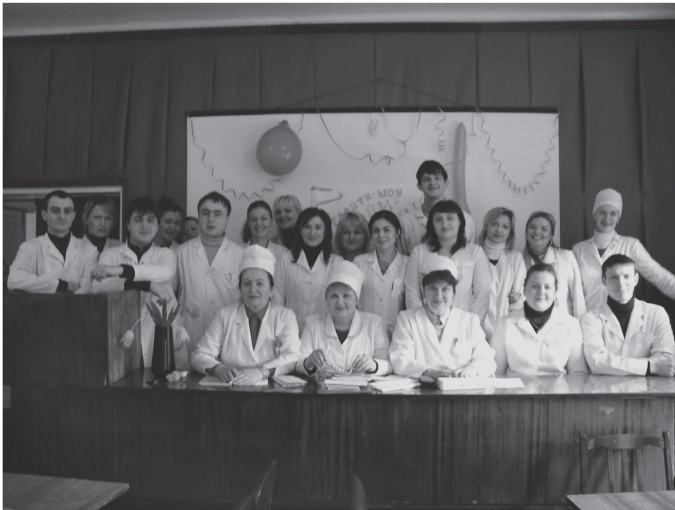
Коллектив кафедры с врачами-интернами

и недостаточная материальная база как на кафедрах последиplomного образования, так и бюджетных учреждений.