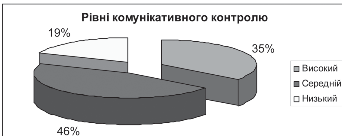
Діаграма 2. Рівні комунікативного контролю старшокласників за методикою М. Снайдер

Середній комунікативний контроль, що спостерігається в 46 % досліджуваних старшокласників, характеризується щирістю, спонтанністю поведінки; нестриманістю в емоційних проявах і схильністю до афектів, образ, конфліктів; схильністю враховувати в своїй поведінці інтереси оточуючих; низькою саморегуляцією.