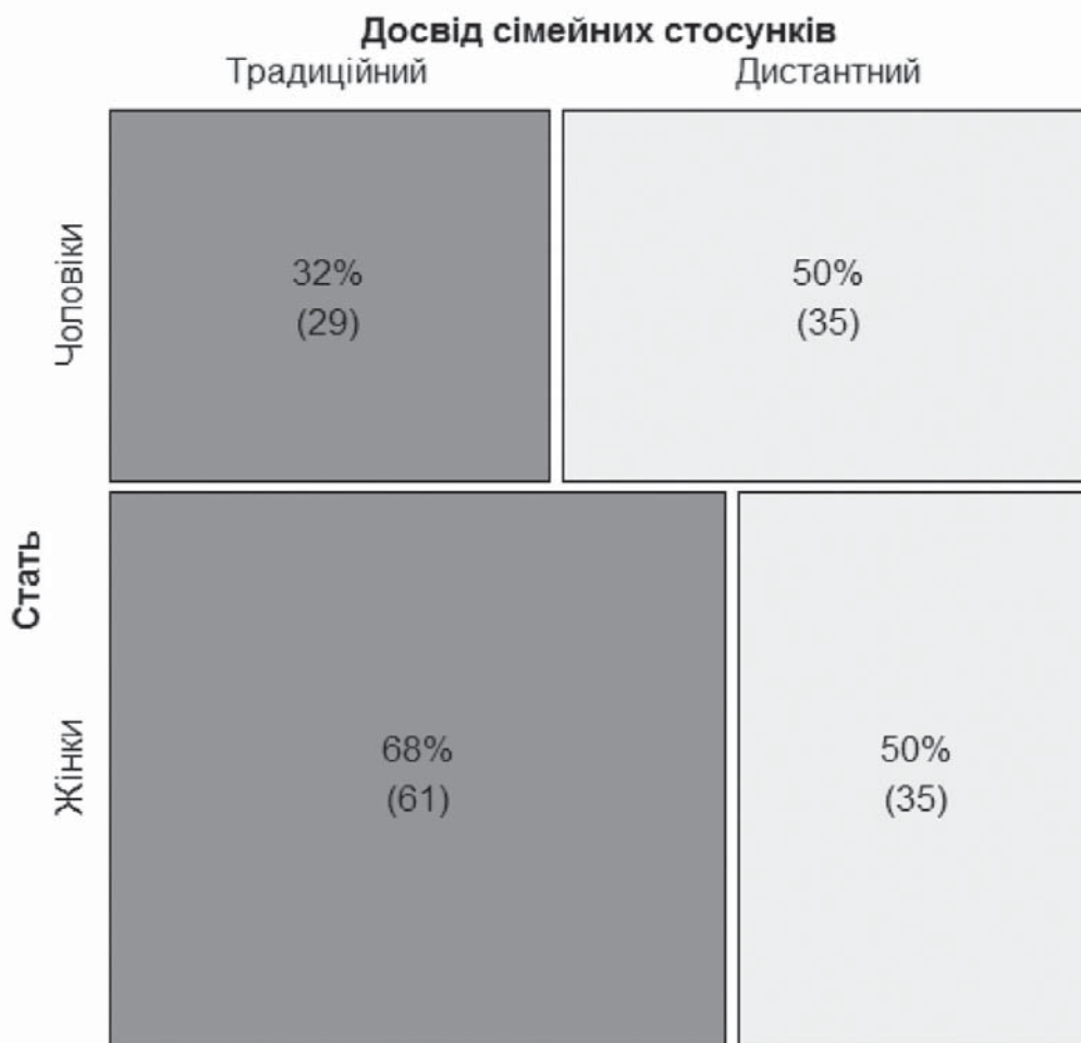
Рис.1. Співвідношення між статтю та досвідом сімейних стосунків

жали жінки ( n = 61 ; 67,8\% ), чоловіки склали не більше однієї третини ( n = 29 ; 32,2\% ). Серед тих респондентів, які мали досвід дистантного сімейного життя, розподіл за статтю був рівний: частка чоловіків та жінок становила не більш 50\% ( n = 35 ). Слід зазначити, що за критерієм хі-квадрат встановлено, що ці дві підвибірки суттєво різнились за гендерним складом ( \chi^2 = 5,185 ; p = 0,034 ). Мозаїчна діаграма, яка репрезентує перехресні табличні дані параметрів досвіду сімейного життя та статі респондентів, наведена на рис.1.