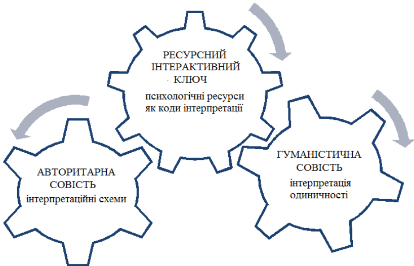
Рис. 2. Моральний і етичний виміри самоінтерпретування особи за допомогою ресурсного інтерактивного ключа

7. Інтерпретування людиною себе у контексті екзистенційної ситуації здійснюється завдяки її доступу до ресурсного інтерактивного ключа. Психологічні ресурси можна схарактеризувати як інтерпретаційні коди досягнення, отриманого людиною у її екзистенціальному досвіді. Доступ до ресурсного інтерактивного ключа зумовлений рівнем самопізнання та рішучістю керуватись гуманістичною совістю (рис. 2).