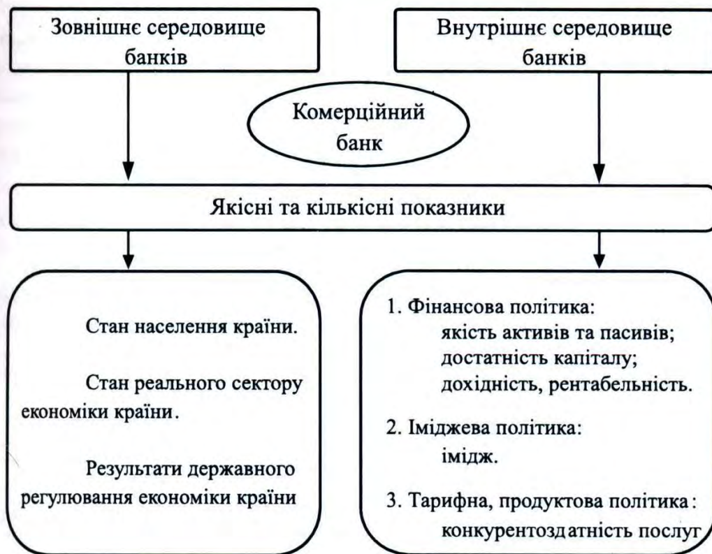
Рис. 1. Критерії, що формують банківську конкурентоздатність

банку відображають кількісні та якісні напрями розвитку а також внутрішні та зовнішні основні фактори успіху кредитної організації, позитивна зміна яких сприяє підвищенню міцності її конкурентної позиції на фінансовому ринку.