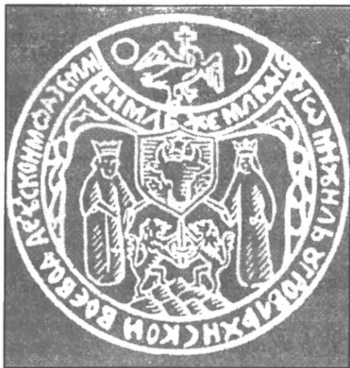
Мал. 6. Велика державна печатка Міхая Вітязула 1600 року, яка фіксує акт об'єднання трьох Дунайських князівств – Валахії, Трансильванії та Молдавії.

створити власну державу. Занепокоєний цим імператор наказав каському комендантові Георгію Басті усунути Міхая від влади [14, с. 344]. Спираючись на підтримку трансильванської знаті, Баста 18 вересня 1600 р. розбив під Міріслеу військо Міхая, змусивши його відступити до Фегерашу. Валаські бояри в той же час визнали своїм господарем Симеона Мовіле (1600-1601) [9, с. 125]. Коронний гетьман Ян Замоїський (1542-1605) скористався тим, що Михай з головними силами залишив Молдавію і був зайнятий в інших областях: у вересні 1600 р. на чолі значних сил Замоїський знов увійшов у Молдавію та Валахію; біля села Букова, неподалік Плоєшть, війська валаського господаря були розбиті, і Молдавія знов потрапила під владу ставленника Польщі Єремії Мовіле [6, с. 32].