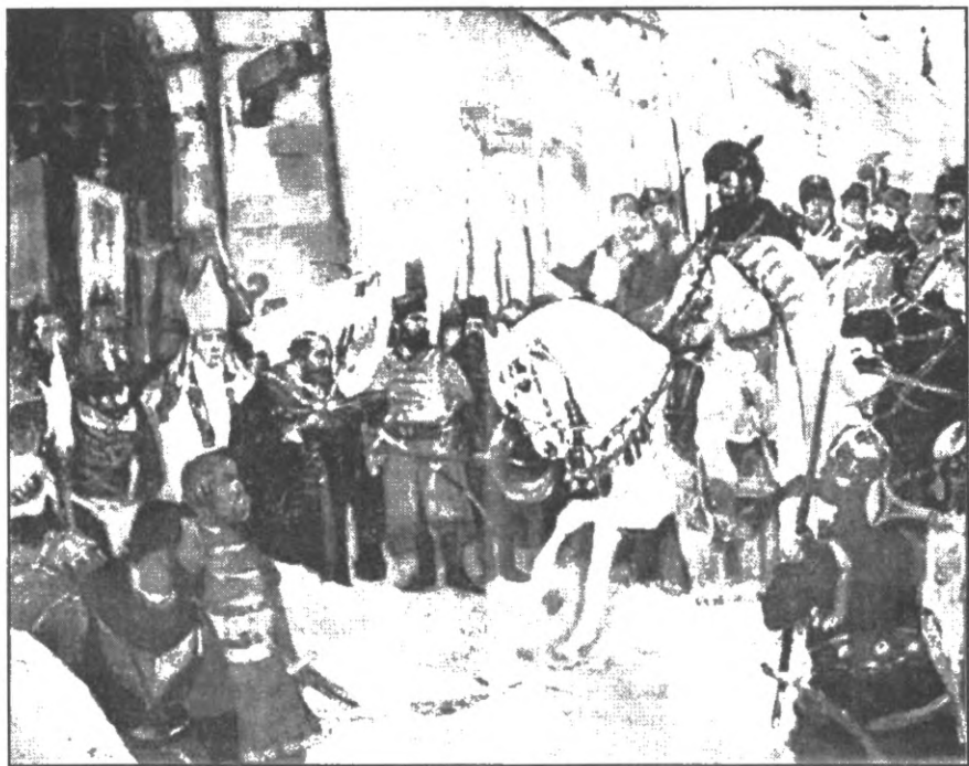
Мал. 5. Урочистий вїзд господаря Міхая Вітязула у Ясси в 1600 р.

Трансільванська аристократія, незадоволена правлінням Міхая, зуміла переконати імператора в тому, що Міхай має намір зрадити домовленостям з Габсбургами і на основі об’єднання Валахії, Трансільванії та Молдавії