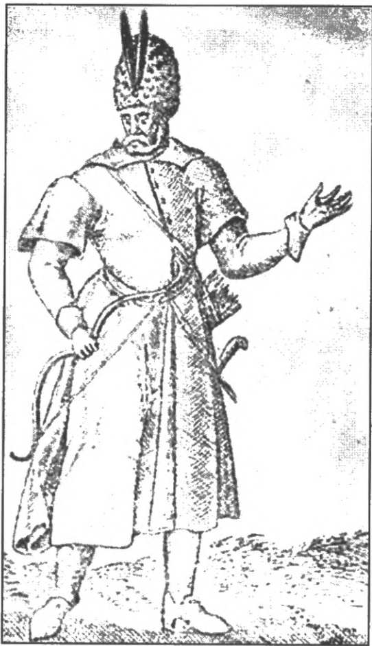
Мал. 3- Б. Валаський піхотинець кінця XVI ст. Амстердам, 1601 р.

Кампанію 1595 р. розпочав Штефан Резван, який зі своїм 7-тисячним військом, посиленням 10 тис. наданих йому у підмогу козаків, вирушив 1 березня у Буджак з метою знищити це „гніздо шершнів, заселене розбійницькою татарською ордою“ [10, с.181]. 5 березня загони Резвана розгромили під Аккерманом (нині – Белгород-Дністровський) спільно зібрані сили буджацьких татар, після чого знищили саму „резиденцію” орди. Однак на початку квітня у невеликій фортеці на правому березі Дністра на них напав калга-султан Фети-Гирей з буджацькими татарами і 10-тисячною кримською ордою, яка через захоплення московитами Перекопу не могла повернутися до Криму. Бій закінчився перемогою татар.