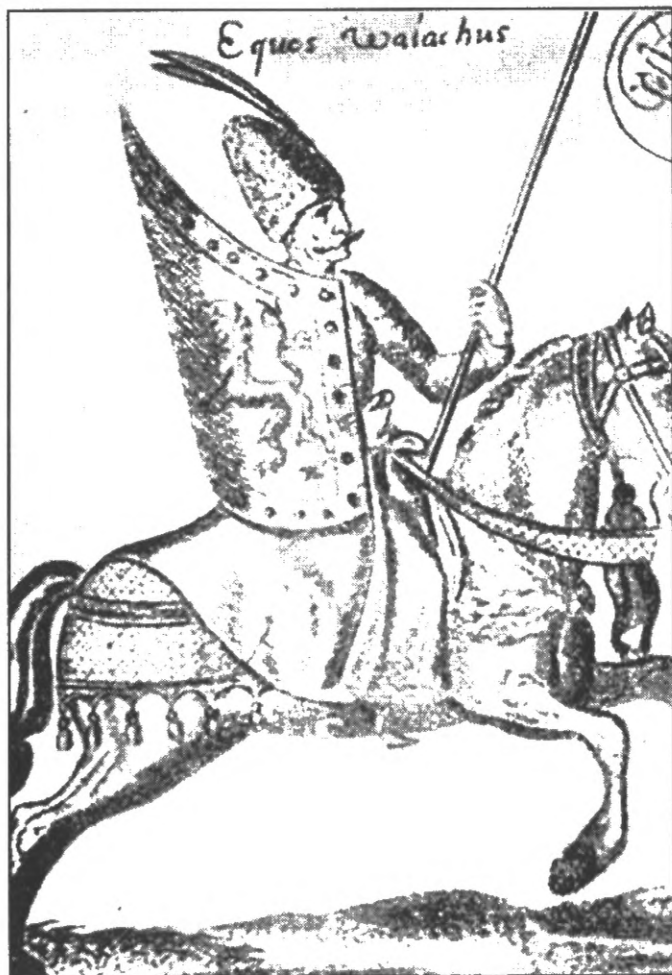
Мал. 3-А. Воїн валаської кавалерії кінця XVI ст. Амстердам. 1601 р.

Головною ударною силою передбачалося зробити сформовану на території Брацлавщини московську армію. Її чисельність становила 37 тис. вояків і, за планом, вона повинна була, зайнявши Молдавію, з'єднатися з військом Польської Корони, яке, за даними джерел, нараховувало 33500 осіб. Таким чином, поперше, чисельність ударної армії досягла б 70 тис. чол., що, включаючи обіцяні молдавський і валаський контингенти, було цілком достатньо для успішного вторгнення у турецькі володіння; а, по-друге, увійшовши у Валахію, це посилене військо мало завдання вийти до Дунаю ще до підходу турецької армії, форсувати його і прийти на допомогу повсталим болгарам.