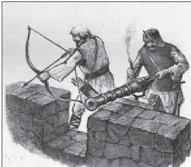
Молдавські воїни другої половини XV ст.