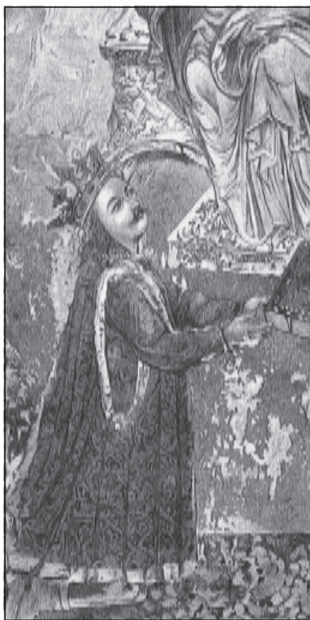
Молдавський воєвода Штефан Великий (мініатюра в тетраєван)

Штефаном III за події 1490 – 1492 рр., усунути його від влади і включити Молдавію до коронних земель, а також відвоювати у турків Кілію та Акерман (Білгород). З метою узгодження своїх дій навесні 1494 р. Ян Ольбрахт зустрівся у м. Левочі (Словаччина) зі своїми братами, королем Угорщини Владиславом II (Уласло), а також Великим литовським князем Олександром та найменшим Сигізмундом (саме його запропонував посадити на молдавський престол король Польщі) [5, с.146]. Колишній наставник польського короля Яна Ольбрахта італієць Філіп Буонаккорсі Каллімах переконував братів, що захоплення Молдавського воєводства дозволить створити у Східній Європі потужний блок країн на чолі з представниками Ягеллонської династії, який протистоятиме як туркам, так і іншим ворогам [36, с.375; 34, с.72; 33, с.234]. Проте угорський король Владислав II, який був сюзереном Штефана III, рішуче виступив проти ідеї усунення його від влади в Молдавії і зажадав, щоби антиосманський похід відбувався у порозумінні й співпраці з молдавським господарем [19, с.130]. Вимушений погодитися з позицією брата Ян Ольбрахт, однак, почав здійснення своєї ідеї власними силами [23, с.9-13; 13, с.61].