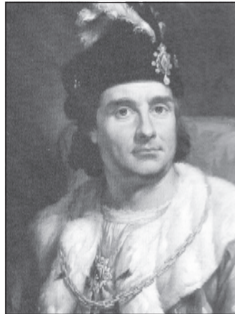
Польський король Ян Ольбрахт (мал. Марчелло Баччіареллі)

Проте, коли у середині серпня 1497 р. польське військо форсувало Дністер біля Михальчєго, вище Городенки, а потім перетнуло кордон Молдавії, молдавські посланці логофет Іон Теутул та вистірник Ісак, які