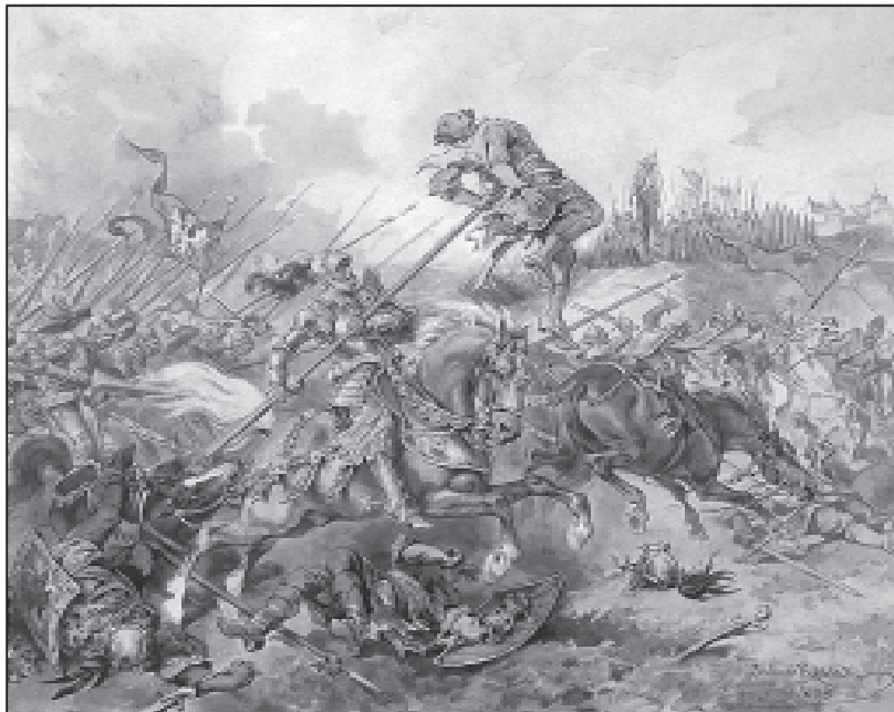
Херубін Гневош в битві під Сучавою в 1497 р. (акварель)

Зібравши рештки свого війська біля с. Козмина, король попрямував до Чернівців [9, с.53; 6, с.131]. На допомогу йому зі Снятина поспішало 600 мазовецьких кіннотників. Молдавський воєвода направив проти нього загін на чолі з великим ворніком Сімкою Болдором, який 29 жовтня розгромив мазовшан під Ленківцями [3, с.33; 5, с. 204; 6, с.132]. Проте того ж дня до короля пробився кількатисячний загін литовської кінноти на чолі з маршалком С. Кишкою (сам великий князь литовський Олександр Ягеллончик з головними силами литовського війська внаслідок демаршу великого князя московського Івана III участі в поході свого брата не брав). Ворніку Болдору не вдалося зупинити його під Шипинцями. 30 жовтня коронне військо з боями перейшло Прут, а 31 жовтня король був уже в Снятині, а звідти поїхав до Львова [13, с.65-66; 5, с.205].