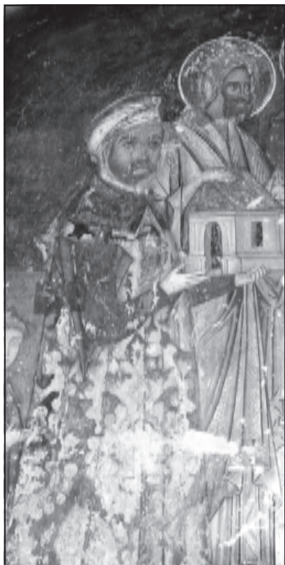
Сучавський портар Лука Арбуре (фреска в монастирі Арбуре)

Облога затягувалася, а Штефан за допомогою своєї легкої кінноти відтяв противнику все постачання з Польщі, забираючи усе, що призначалося для табору [23, с.32]. За таких обставин здавалося, що ті, хто обстрілював місто з великих гармат, оточивши свої табори для захисту возами, опинилися, за словами Б. Ваповського, «самі в облозі, почавши відчувати себе голодними, оскільки прилеглі місця були позбавлені харчів і голод дошкуляв як людям, так худобі» [10, с.183].