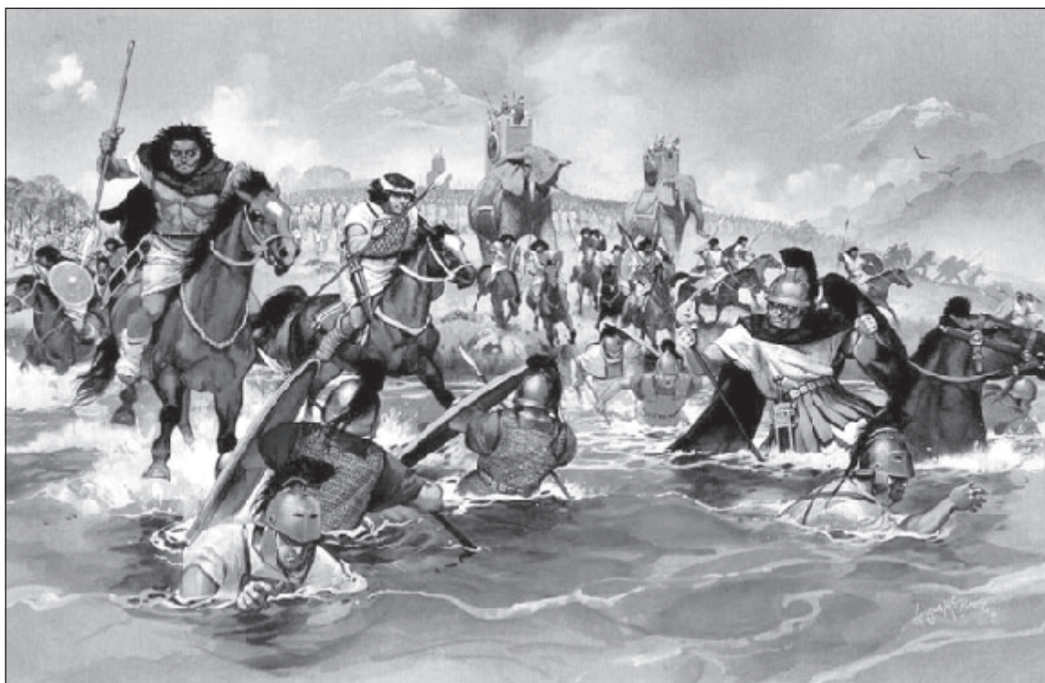
Мал. 1. Нумідійська кавалерія атакує римлян при Требії. 218 р. до н. е. Реконструкція Р. Хука.

Типовим для легкої африканської кінноти було влаштування засідок на місцевості. Традиційно їх поділяють на два види. Яскравий прояв першого спостерігається в битві біля Требії (218 р. до н. е.) [10. XXII. 48. 2]. Чисельний загін нумідійців зайняв позицію поблизу поля бою, в яру та заліг. У вирішальний момент битви кіннотники завдали удару по флангу й тилу римського війська. Полібій вважає, що головним для успіху такої тактичної хитрості є надійне приховування мечів, щитів, дротиків, тобто предметів, які можуть видати засідку блиском або характерною формою [6. III. 72]. Фронтін, у свою чергу, запевняє, що під час нальотів маври намагались збільшити ефект, спричинений несподіванкою, «роблячи потворні гримаси та загрозово волаючи» [11. I. 5. 16]. Інший вид засідки