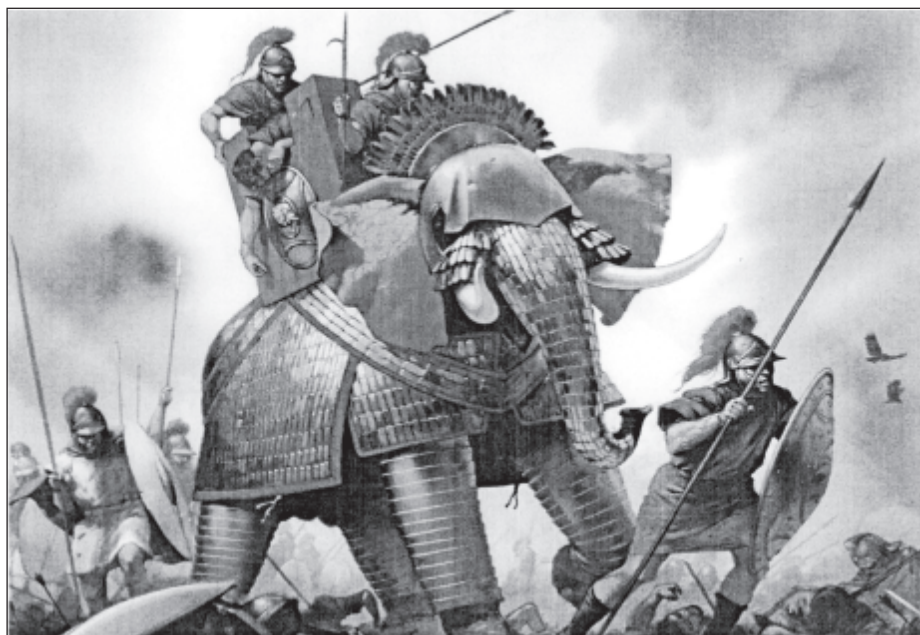
Мал. 2. Африканський та індійський бойові слони. Реконструкція Т. Візе.