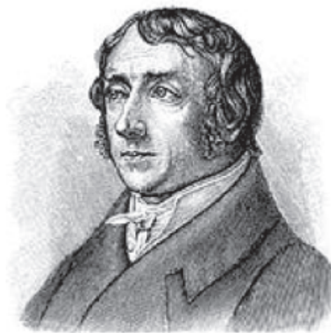
Іл. 1. Бартольд Георг Нібур

Німецька історіографія, присвячена правлінню Пірра, бере свій початок з праці Бартольда Георга Нібура (1776-1831 рр.) (іл. 1.) «Римська історія» [42]. Це дослідження залишилося незавершеним, а останній четвертий том було видано вже після смерті автора й опис подій доведений лише до Першої Пунічної війни (241 р. до н. е.). Звертаючись до сторінок біографії видатного німецького історика, слід відзначити, що він народився 1776 р. в м. Копенгаген у сім'ї відомого датського мандрівника-орієнталіста і математика Карстена Нібура. Після здобуття вищої освіти в Кільсько-