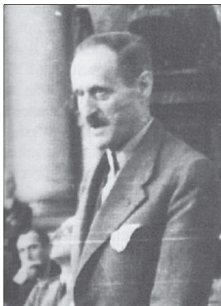
Ил. 3. Ульріх фон Хассель

Окремі роботи по Пірру побачили світ протягом 40 – 60-х рр. ХХ ст. В даному сенсі варто виділити книгу «Підр» Ульріха фон Хасселя (іл. 3.), присвячену особистості та зовнішньополітичній діяльності царя Епіру. Слід зауважити, що автор не історик, а професійний дипломат, котрий був багато років консулом у Барселоні. Отже, не дивно, що він переважно досліджує суто дипломатичні стосунки Пірра з правителями середземноморських держав. Хассель, наприклад, приділяє велику увагу договору Рима з Карфагеном [37, с. 36-37]. Аналізуючи результати битви при Беневент, він приходить до висновку, що битва завершилась для Римської імперії в кращому випадку «нічиєю» [37, с. 67]. В цілому У. Хассель, разом зі Г. Штолем [30], характеризують Пірра як талановитого полководця, але слабого політика [37, с. 75].