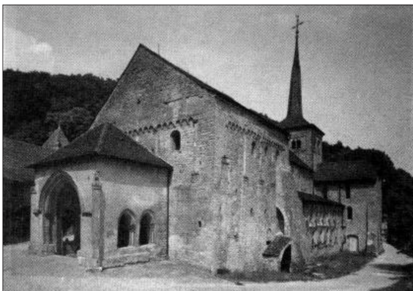
Древня церква монастиря Романмутьєр, зведена у VI ст.

На Заході, як відомо, VI ст. стало добою великих творців киновітних удосконалених статутів, що склали противагу анахоретним. Серед них у першу чергу можна згадати чернечі правила Св. Кесарія Арльського [28, с. 301-314; 29, с. 208-254], Св. Бенедикта Нурсійського [30, с. 51-52], Св. Колумбана Люксельського й Боббійського, який жив у Галлії, а згодом підвизався в Італії [38, с. 94-96]. В Кондадиско також існував свій «Статут», орієнтований на «клімат країни і на необхідність праці» так само, як і на «галльську розслабленість» [27, Гл. 174].