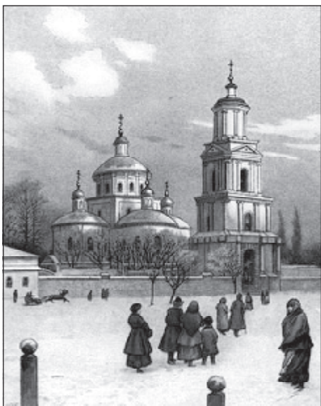
Свято-Троїцький кафедральний собор у Белгороді

Молдавського митрополита. В історію Молдавського князівства він увійшов як ошадливий господар, щедрий ктитор та донатор чернечих обителей, книжник і просвітител. 1739 рік став для владики Антонія нещасливим. Як русофіл, молдавський архієрей змушений був емігрувати до Російської імперії. Там його винагородили за допомогу російським військам кафедрою митрополита Чернігівського. Пізніше перевели в Белгород. У цих чужих для нього епархіях колишній молдавський архієрей через свої зловживання здобув погану репутацію та чисельні доноси місцевого кліру. Проте до кінця життя Антоній (Черновський) не забував свою рідну Молдавію, залишався щедрим донатором Путнянського монастиря та покровителем співвітчизників, які навідувалися до Росії. Він так і залишився своїм між своїх і чужинцем між чужими.