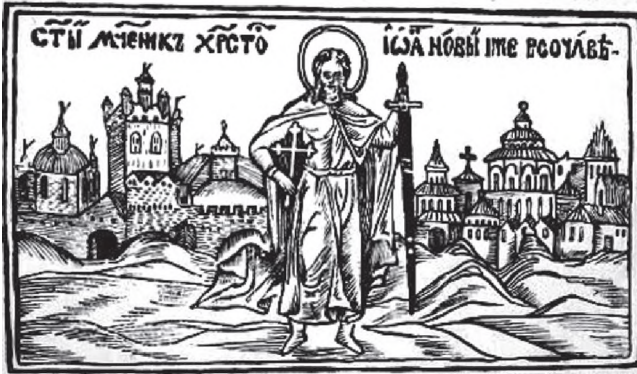
Рис. 2. Св. вмч. Іоан Сучавський (гравюра з Книги митрополит)

Фортеця висока, башти міцні, ворота вузькі, рови довгі, так що птасі неможливо проникнути. На її вежах розташовані гармати, усі великі, припасів і провізії достатньо. У ровах фортеці містяться нерухомі палі із заліза та дерева, влаштовані інші перепони. Фортеця так добре укріплена, що її важко взяти. На вежах попіклувалися влаштувати дзвіниці, у яких починають майстерно дзвонити, як тільки щось побачать. Коли турецьке військо прибуло сюди, воно заклало табір в околицях, на довколишніх долинах, горах, пагорбах і полях» [17, с.269]. Далі хроніст повідомляє, що Сучавська фортеця здалася султану без бою, а «представники цієї землі, син колишнього воєводи, священники та купці присягнули на вірність падишаху» і той поставив воєводою Штефана [17, с.269-271]. Так Молдавське воєводство опинилося під пануванням Османської імперії.