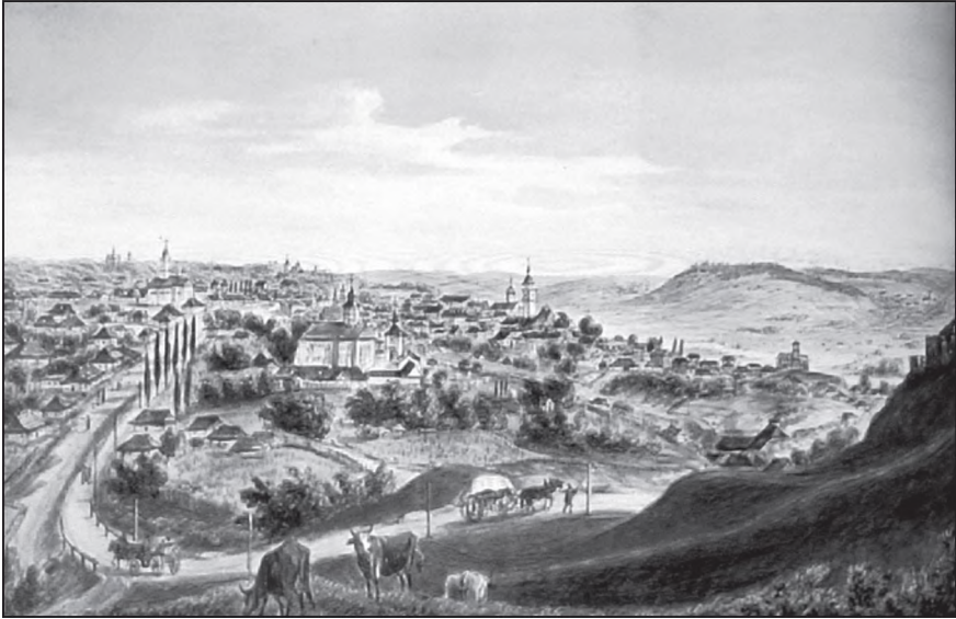
Рис. 5. Сучава. Акварель Ф. Яшке (20-ті роки XIX ст.)

св. вмч. Іоана Нового Сучавського. Саме у той час воно пережило період найбільшого піднесення і розвитку, коли в Сучаві були збудовані найбільш визначні пам'ятки міста. Після перенесення у 1564 р. столиці Молдавії до Ясс Сучава поступово занепадає, перетворившись на звичайний волосний центр на чолі з ісправником. Свій провінційний характер місто продовжувало зберігати й на час включення його, разом з усією Буковиною, до складу імперії Габсбургів.