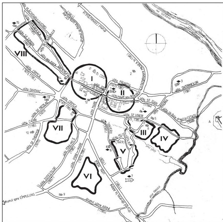
Рис.3. План старої Сучави

З кінця XVI – початку XVII ст. в місті стали з'являтися перші кам'яні будинки. Одна така кам'яниця, збудована господарем Мироном Барновським-Могилою (1626 – 1629, 1633), збереглася під назвою «Hanul Domnesc» [58, с.17].