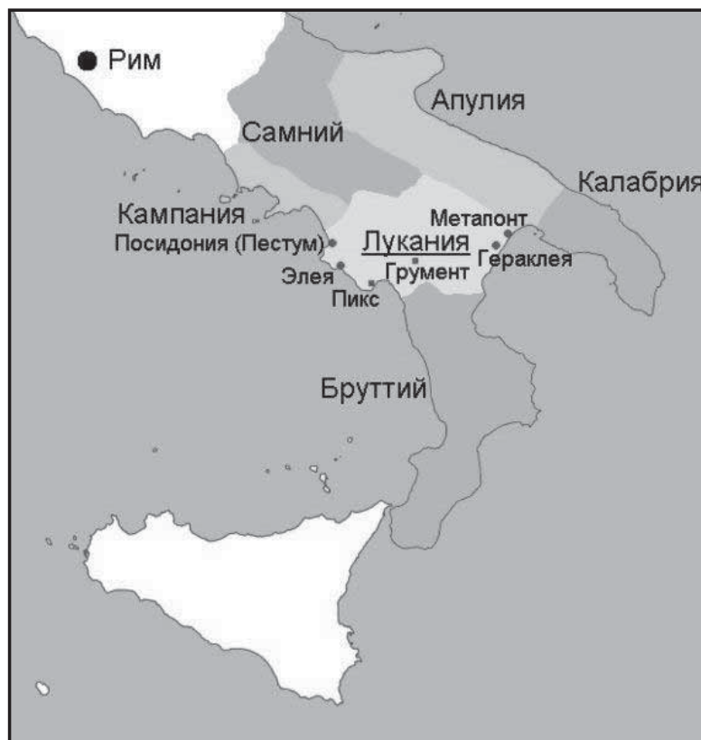
Мал. 3. Стратегічно важливі області Південної Італії.

Конфлікт поступово загострювався, однак кульмінацією став випадок 282 р. до н. е. Коли в Таренті святкували Великого Діонісія (це містерія на честь Діоніса – бога врожаю і вина, яка влаштовувалась весною, коли пробуджувалась природа; під час святкування виступали хори, які склалися з одягнених у козячі шкури співаків. Останні зображали свиту бога Діоніса, який несе людям всієї країни радість і веселощі. Хор виконував дифірамби – особливі гімни, в яких прославляли Діоніса та розповідали про перемоги бога над ворогами. Пісні змінювалися запальними танцями.