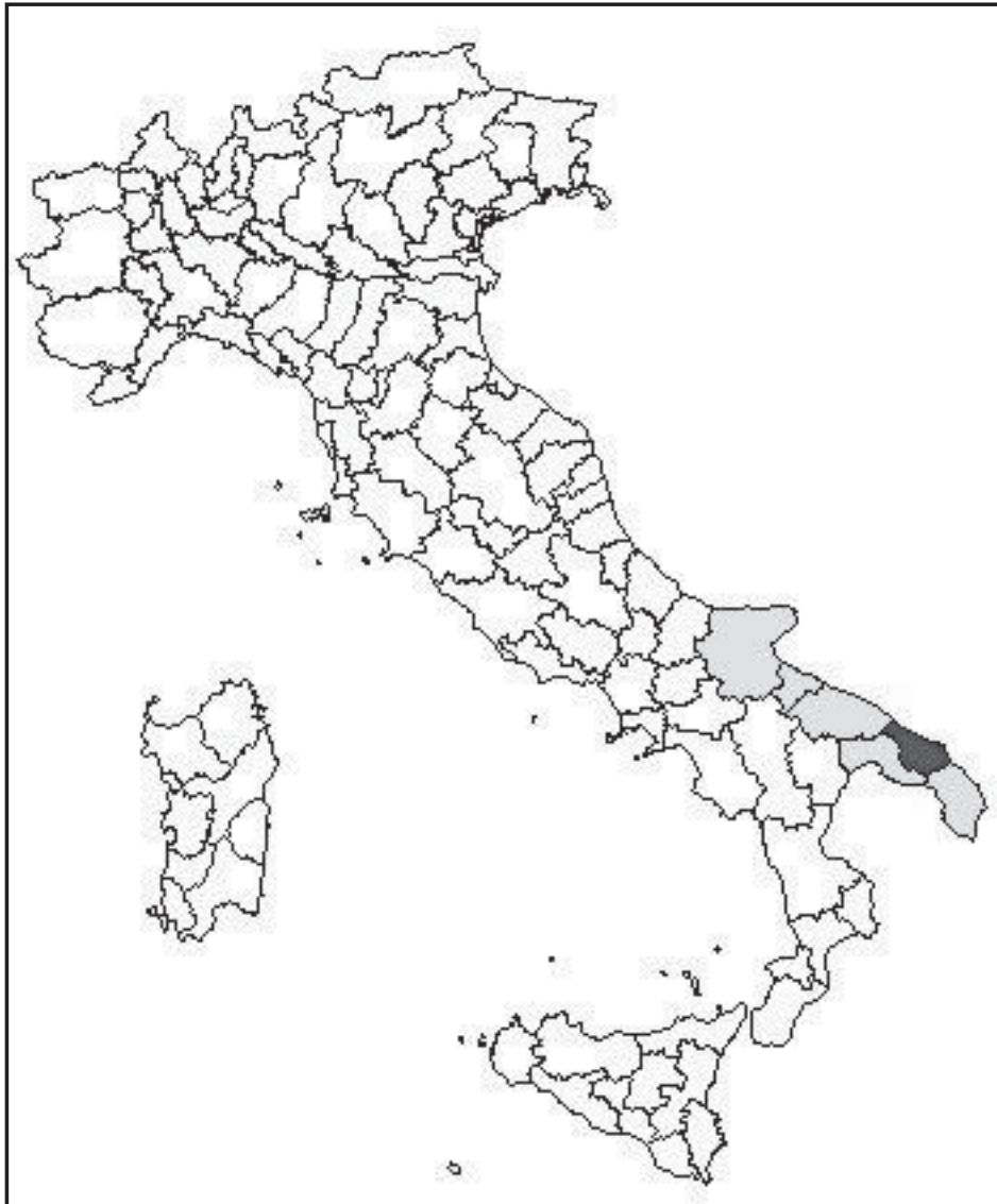
Мал. 2. Розташування міста Брентезія (сучасна назва – Бріндізі)

можна дізнатися про його наукову діяльність і світоглядні уподобання. Він походив зі знатної грецької родини, з раннього дитинства вивчав філософію, музику, математику, цікавився піфагорійською філософією. Згодом, з настанням повноліття, Архіт починає займатися політичною діяльністю; його неодноразово обирали на посаду головного стратега. Він прославився і як талановитий полководець: декілька разів очолював військові походи проти латинських племен та повертався переможцем. Саме ці перемоги дозволили Архіту здобути авторитет серед грецької еліти [16, с. 447-458].