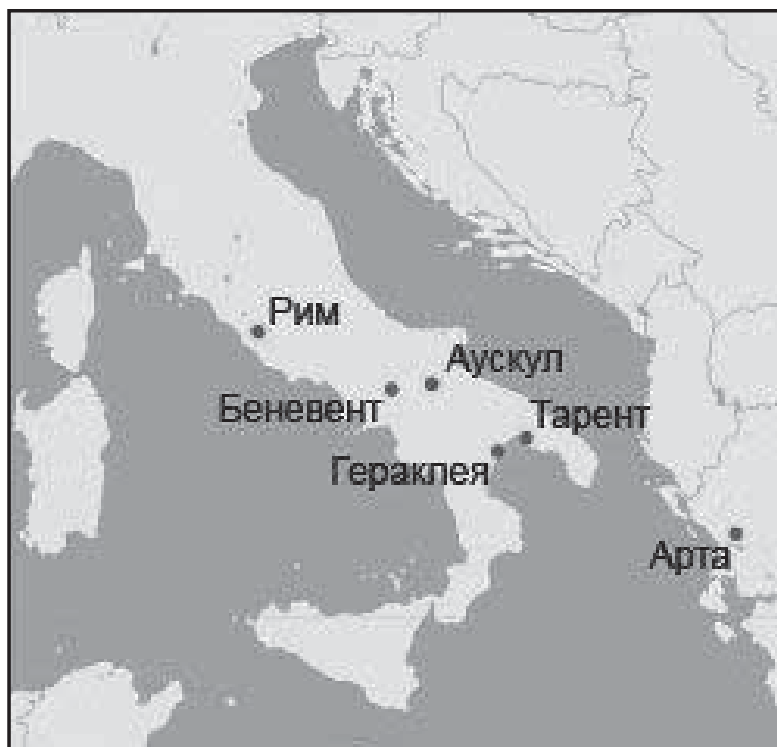
Мал. 1. Головні міста території Південної Італії

педикулів, калабрів, салентінців, апулійців [14, VI, III, 1; 3 7.170]. Немає також згоди ні щодо значення кордонів, ні стосовно походження етносів-автохтонів, та напрямків племінних пересувань. Ще Т. Моммзен висловлював думку про „єдиний італійський народ”, який в основі складається з латинян та самнітів [47, с.27], але подібна точка зору не отримала підтримки наступних дослідників.