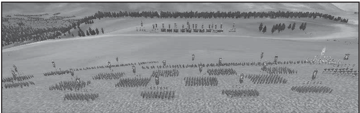
Мал. 6. Розташування римської армії в битві при Аускулі. Сучасна реконструкція.

Гай Нуміцій. Він зміг поцілити мечем у хобот однієї з тварин [6, I, 13, 9]. Як свідчать подальші події, цей подвиг не допоміг римлянам переломити хід битви, оскільки кіннота Пірра на флангах також здолала кінні загони римлян; армія Деція і Сульпіція почала втікати.