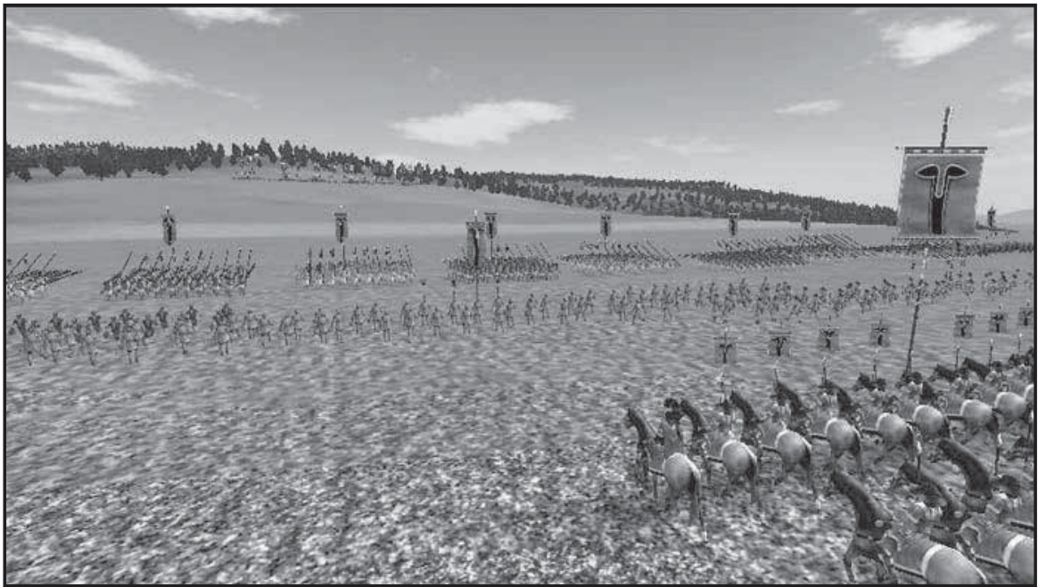
Мал. 5. Позиції Пірра в битві при Аускулі. Сучасна реконструкція.