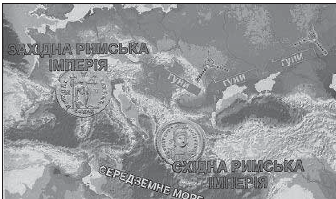
Мал. 1. Шлях гунів територією Європи у першій половині V ст.

Про те, що на початку літа 451 р. “Батіг Божий” має почати похід у Італію, знало (й чекало на це) населення західних провінцій Імперії. Відповідна інформація міститься в численних листах Римського понтифіка Лева Великого (440-461) (див. мал. 2), і тільки в них. Офіційне листування Первосвященника Апостольської Столиці з імператором Сходу зберігає багато маловідомих фактів, які проливають світло на тогочасну європейську політику та дипломатію. Наприклад, у листі від 23 квітня папа висловив візантійському василевсу Маркіану (450-457) переконання, що “співдружність” двох правителів Імперії подолає “помилки єретиків і ворожі дії варварів” [26, IV, 41].