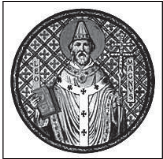
Мал. 2. Римський понтифік Лев I Великий.