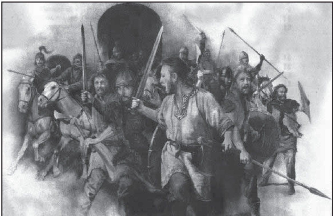
Мал. 6. Піратський набіг вандалів. Сучасний малюнок.