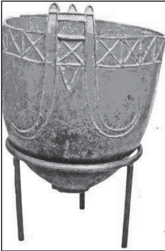
Мал. 3. Бронзовий “гунський казан”. V ст.