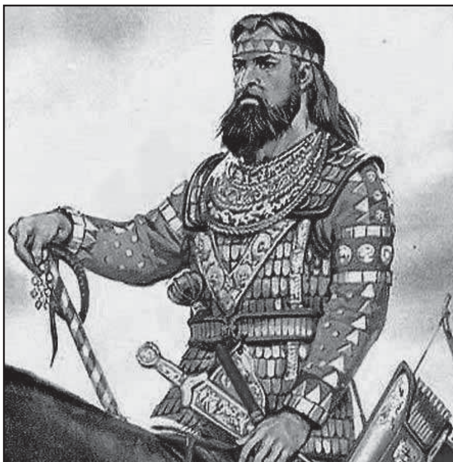
Мал. 7. Аланський вождь і візантійський воєначальник Аспар. Сучасний малюнок.

(див. мал. 5); через малу кількість воїнів, які чатували на цих вежах, така залога не була в змозі протистояти просуванню ворожого війська. Castellum ad pirgum на гірських італійських дорогах налічував у середньому 8-10 воїнів [64, с. 132]. Подібний загін максимум що міг зробити – тимчасово притримати або уповільнити наступ ворога. По-третє, і це важливо, Аецій діяв так само, як і будь-який інший римський полководець до нього та після нього у тотожній ситуації.