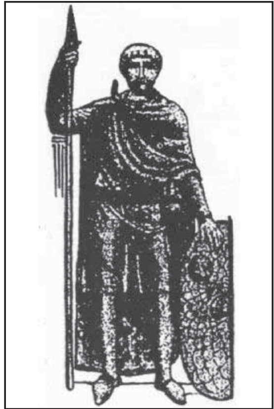
Мал. 4. Римський полководець Аецій. Різьблення по слонової кістці. V ст.

про небезпеку великої кампанії в літню пору. І все ж – чому він атакував? Власну мотивацію дій вождя гунів висуває О. Менчен-Хелфен. Він, зокрема, пише: “Аттіла, безсумнівно, був “у гніві від несподіваної поразки, якої зазнав у Галлії, згідно з “Хронікою 452 року”, єдиного джерела для встановлення своєрідного мосту між двома війнами. Він, природно, ненавидів Аеція. Однак чому він не почекав хоча би рік для реваншу? Його відносини зі східними римлянами не могли бути найгіршими. Коли він вирушив у похід в Галлію 451 р., нібито для битви з вестготами, імператор Маркіан залишився байдужим. Аттіла, природно, не міг розраховувати на нейтралітет східної частини Імперії, якби він вторгся в Італію. Він, можливо, сподівався розбити армію Аеція перш ніж Схід (Візантія. – Я.Я.) прийшов би на допомогу Заходу. Він, можливо, вважав, що якщо його вершники оволодіють долиною По, то Аецій відразу ж запросить миру. Можливо, він чекав, що Валентиніан пожертвує Аецієм для збереження свого трону” [77, с. 98].