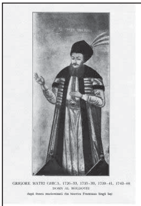
Рис 7. Молдавський господар Грігоріе Матей II Гіка