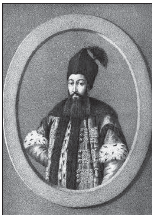
Рис 8. Господар Григорій III Гіка