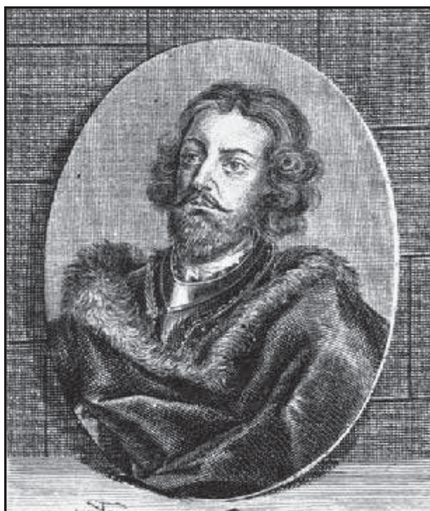
Рис 1. Воєвода Димитріє Кантемир