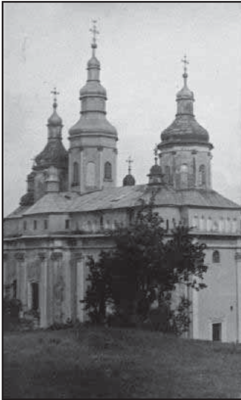
Рис 10. Монастирська церква Різдва Пресвятої Богородиці на Горечі (фото 1936).