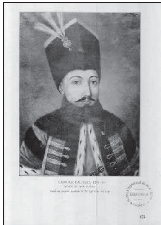
Рис 6. Молдавський воєвода Григоріє Каллімахі