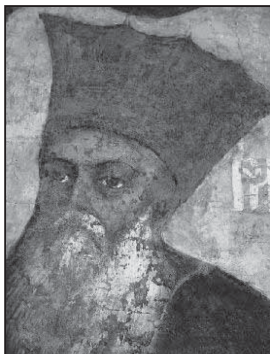
Рис 3. Воєвода Молдавії Міхай Раковіце