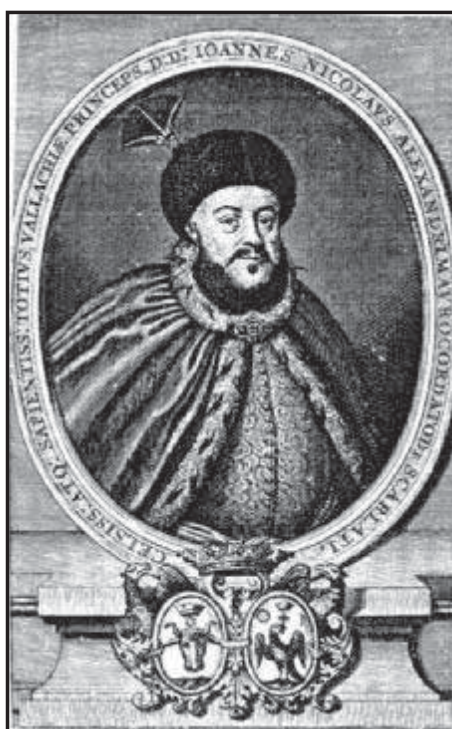
Рис 2. Воєвода Ніколає Маврокордат