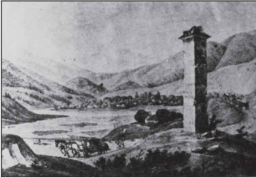
Рис 4. Стилпул-воде у Вамі (рис. Ф. Яшке)