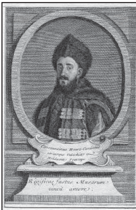
Рис 5. Молдавський воєвода Константин Маврокордат