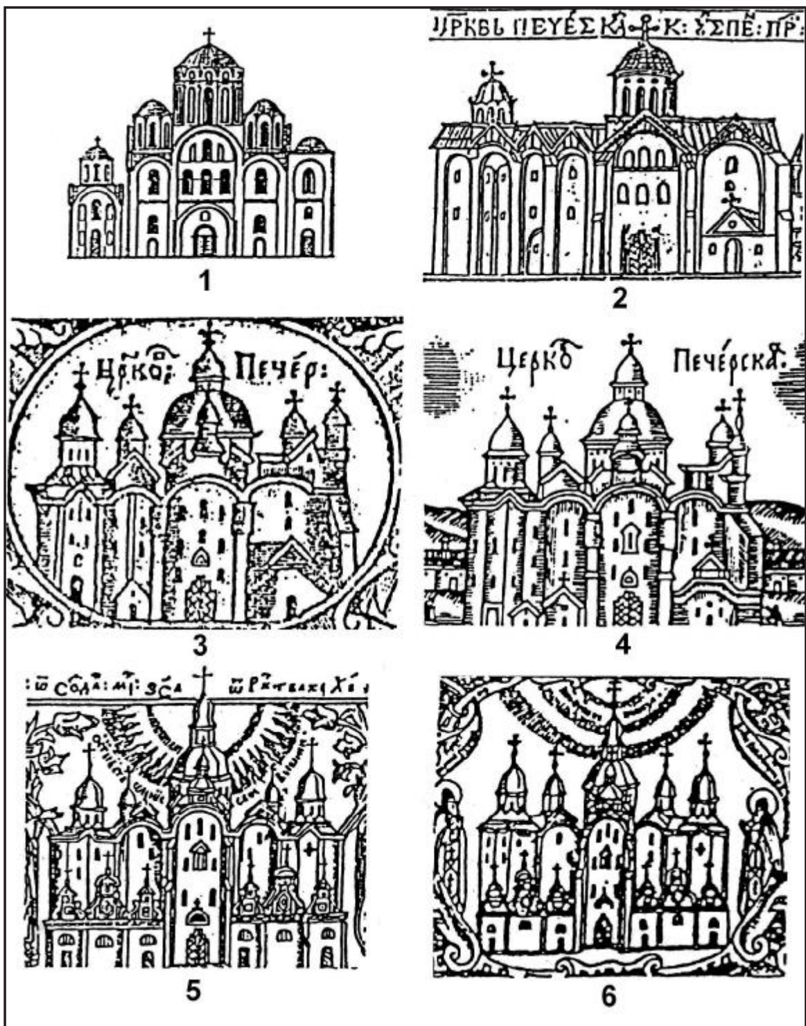
Рис. 1. Зовнішній вигляд Успенського собору за іконографічними даними: 1 – 1080-1108 рр.; 2 – початок XVII ст.; 3 – 70-і рр. XVII ст. – 1677 р.; 4 – 1677-1687 рр.; 5 – 1690-1695 рр.; 6 – 1685-1894 рр.