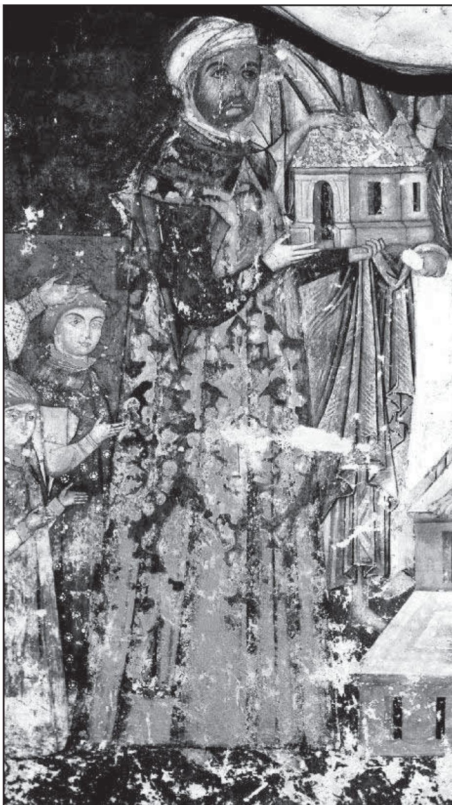
Мал. 2. Сучавський портар Лука Арборе