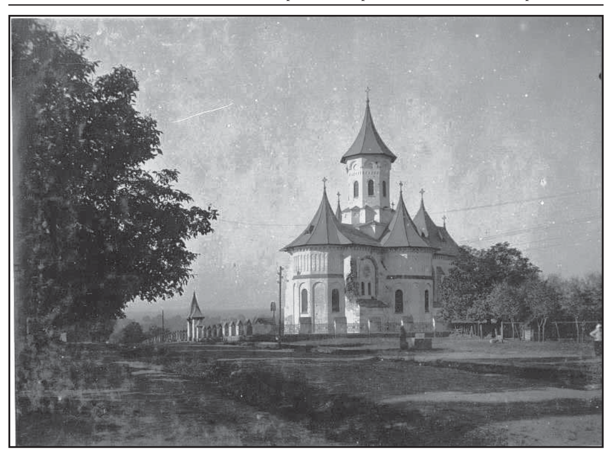
Рис. 3. Церква св. Іллі в Топорівцях. 1917 р..