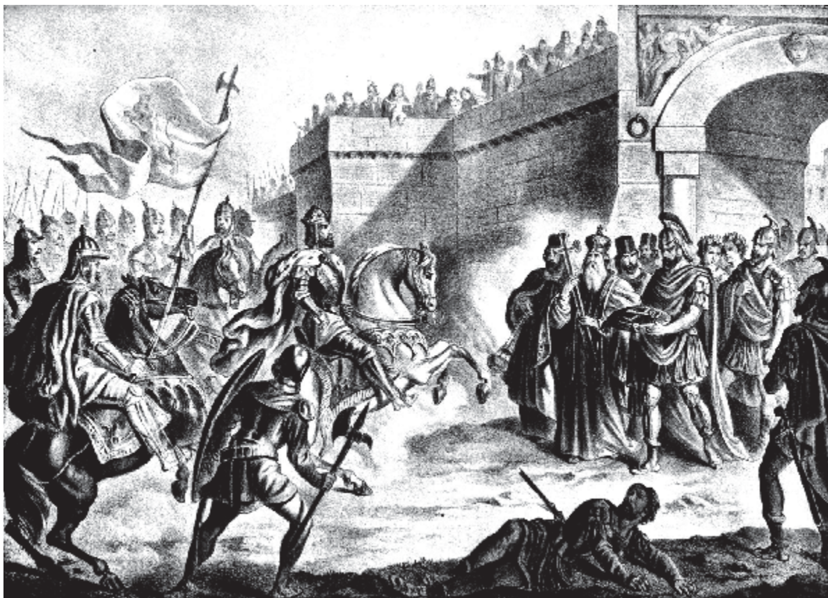
Рис. 1. Болгарський цар Симеон I Великий біля воріт Константинополя (за картиною Н. Павловича, 1917 р.)

угрів окремо. Пізніше болгарський правитель ув'язнив Лева. Виступивши в похід проти угрів, коли вони не отримували допомоги від візантійців і були покинуті Левом, цар Симеон знищив їх та спустошив усю їхню землю, що ще більше налякало сусідів болгар. Повершувшись, він знайшов Лева (хойросфакта) в м. Мудагра (Μουδάγρα) і заявив, що не укладе миру, поки не отримає усіх полонених. Пізніше усі полонені були повернуті до Болгарії [5, с. 91-94].