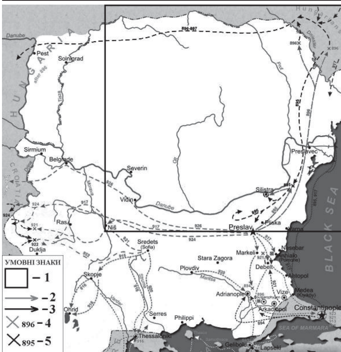
Рис. 2. Війни царя Симеона I Великого (893-927 рр.): 1 – територія ведення бойових дій між болгарсько-печенізькими та візантійсько-угорськими військами у кінці ІХ ст.; 2 – походи військ царя Симеона в Подністров'я та Побужжя (894-896 рр.); 3 – бойові дії візантійсько-угорських військ (894-896 рр.); 4 – місця битв, які завершилися перемогою об'єднаної коаліції болгар та печенігів; 5 – місця битв, які завершилися перемогою візантійсько-угорського війська.