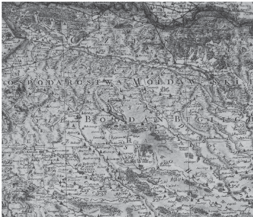
Волості та поселення Молдавської землі на карті кордонів Польщі з Молдавією, виконана фон Ріці-Заноні (друга пол. XVIII ст.). Фрегмент.

правовими питаннями, а більше фіскальними, зростає на селі одночасно з утвердженням фанаріотського режиму в Молдавії, який посилив державну експлуатацію селян. З 40-х років XVIII ст. в обов'язки сільських ворників стали входити головним чином адміністративно-фіскальні функції. Господар Молдавії К. Маврокордат вимагав, щоби двірники сіл не призначалися власниками, або ісправниками, але обиралися сільськими громадами на зборах [12, с.189].