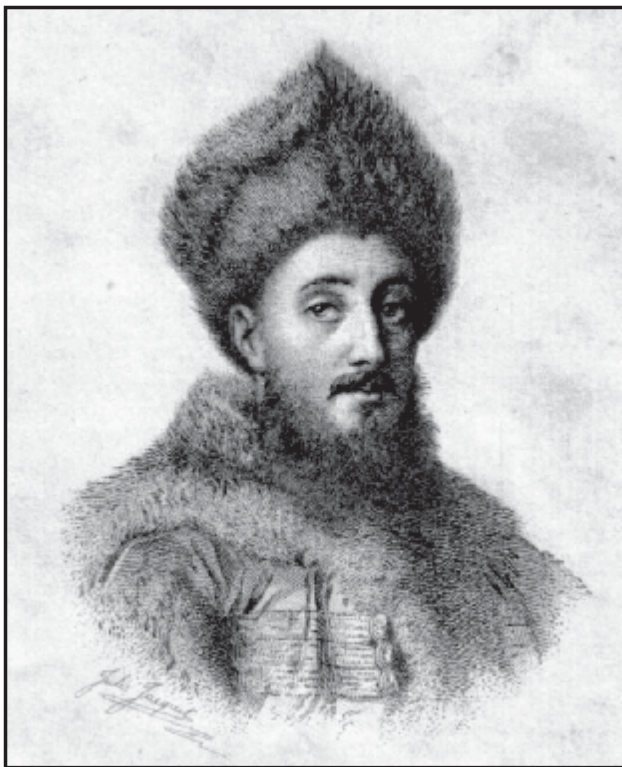
Молдавський воєвода Константин Маврокордат (гравюра Ж. Жаке).

Звідти прямо в гору, через скелю, на яку поставили мітку; звідти прямо через гірку до початку улоговини і встановили стовп під дубом, а дуб відзначили; звідти прямо в гору, через дорогу, що йде з Кобилчина та веде в Секурени і прямо через долину, звану Заріче, понад болотом з верболозом, через три пагорби, встановили стовп під деревом, а дерево відзначили; потім прямо в гору і через улоговину, звану Фундоая, прямо в гору до хотаря Клокушни, встановили стовп під деревом, а на дереві поставили мітку.