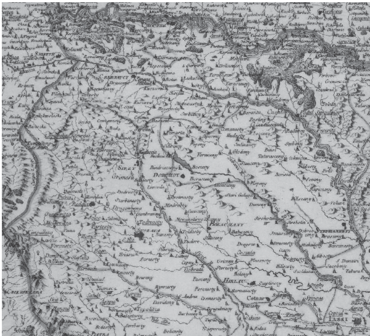
Карта волостей і поселень Молдавії, видана 1770 року ла Руге в Парижі на основі карти Д. Кантемира. Фрагмент.