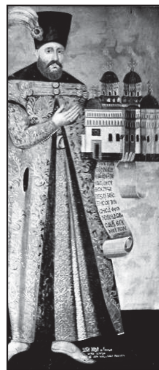
Молдавський воєвода Георгій Дука (фреска в монастирі Четецуя- Ясси).

до довгої гори, а звідси вниз й через потічок великий, який тече від Іванкауць до довгої гори, і від неї прямо до Прута. Межа від Бергомета була позначена за життя нашого батька Василіє воєводи тамтешніми межуваньниками Ісаром Грама, Ісаком Кокоранул і Петрашком Цінте, які поставили камені. Але ватаман Ісак був незадоволений і переніс разом з людьми з Бергомета межу далі в хотар Добовецький, і тоді наш боярин Ружіне, ворник, разом з іншими межуваньниками засвідчили як Ісак, ватаман, переставили безправно камені. Наша