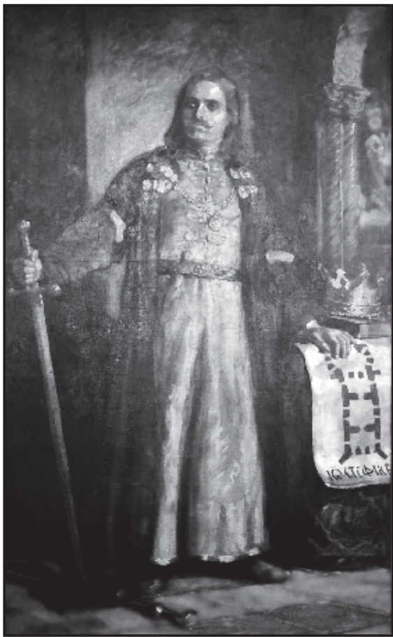
Молдавський воєвода Штефан Великий (худ. Є. Максимович).

існував інститут ватамана (ветемана), який прийшов на зміну колишнього керівника вільної селянської общини – князя [22, с.35]. Наприклад, у грамоті від 25 грудня 1422 р. господар Олександр Добрий, жалуючи пану Богушу за вірну службу «єдно село оу нашої землі, оу Молдавскої, Кучуров», згадує, що там «быль ватаманъ Германъ» [6, с.76]. Сільському ватаману допомагав ворничел. Зазвичай, ці посадові особи призначалися світськими чи духовними власниками села [12, с.180].