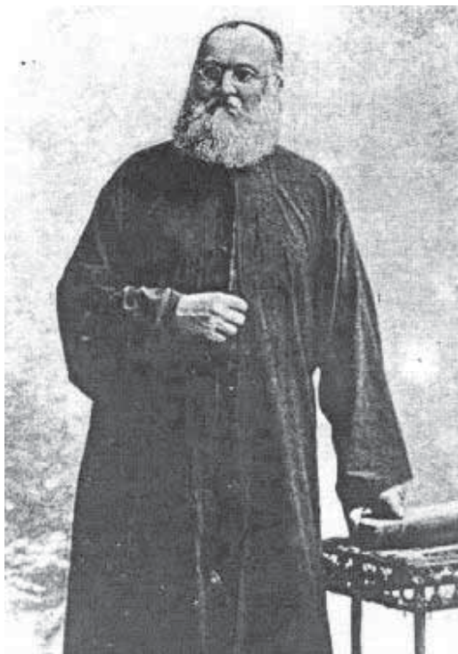
Мал. 4. Іраклій Порумбеску.

Константин Мораріу (1854–1927), Василій Томка, Димітрій Дан (1856–1927), Іраклій Порумбеску (1823–1896) (мал. 4), Ісидор Ончул (1834–1897), Штефан Репта (1834–1897), Анімпадист Дашкевич, Йозеф Флейшер (1857–1900), К. Мораріу (мал. 5), Віктор Преміж, Димітрій Ісопеску (1839–1901), Ф. Вікенгаузер, Франц Логес (1864–1914), Сіміон Флоря Маріан (1847–1907). Не останню роль відіграв і відомий тогочасний колекціонер археологічних знахідок на Буковині Д. Олінеску. Варто також зазнача-