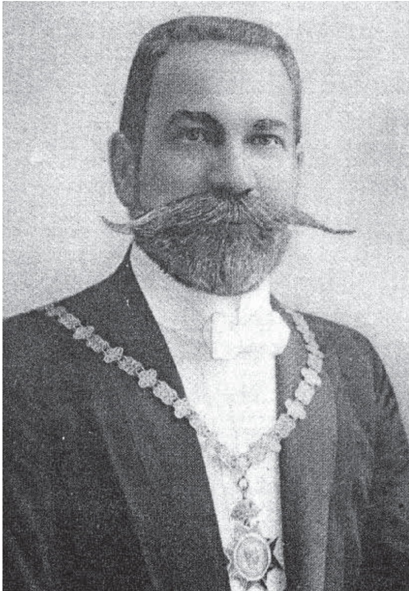
Мал. 14. Раймунд Ф. Кайндль.