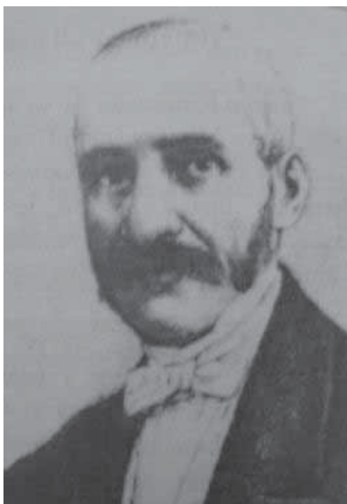
Мал. 8. Арон Пумнул.

Надалі Арон Пумнул (1818-1866) (мал. 8), Євдоксій Гурмузакі (1812–1874) (мал. 9) та Георгіє Костін доклали багато зусиль, щоби ця колекція значно розширилась і перетворилась на музейну