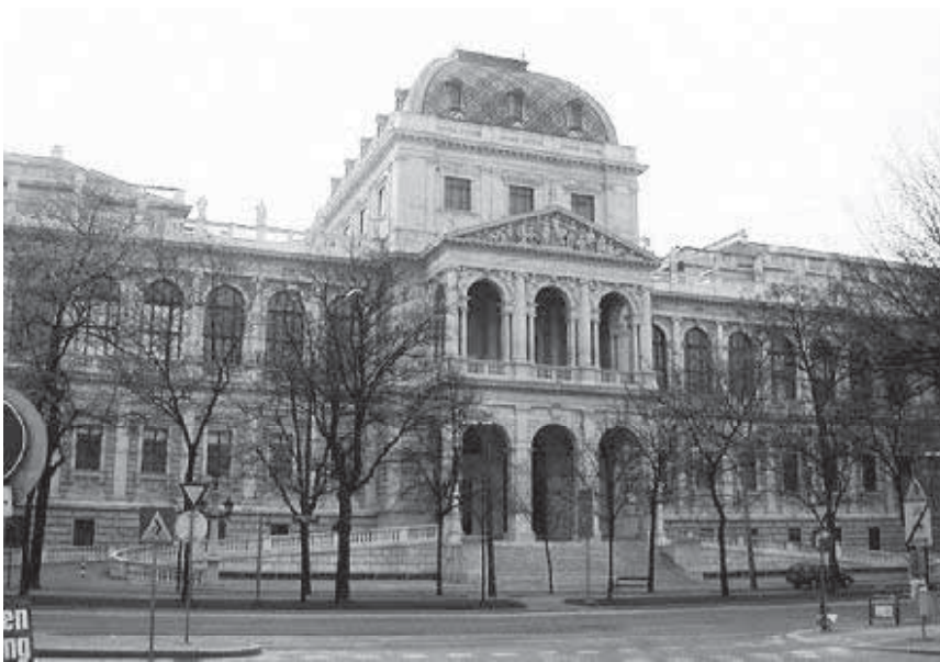
Мал. 22. Віденський університет. Центральний корпус. Сучасне фото.

тільки монети, які не зазнали суттєвих пошкоджень. Цікаво відзначити, що Е. Фішер після війни таки опублікував (1929 р.) ґрунтовну нумізматичну монографію, присвячену монетам середньовічної Молдови, у вигляді додатків подав фотографії всієї колекції [34, с. 70].