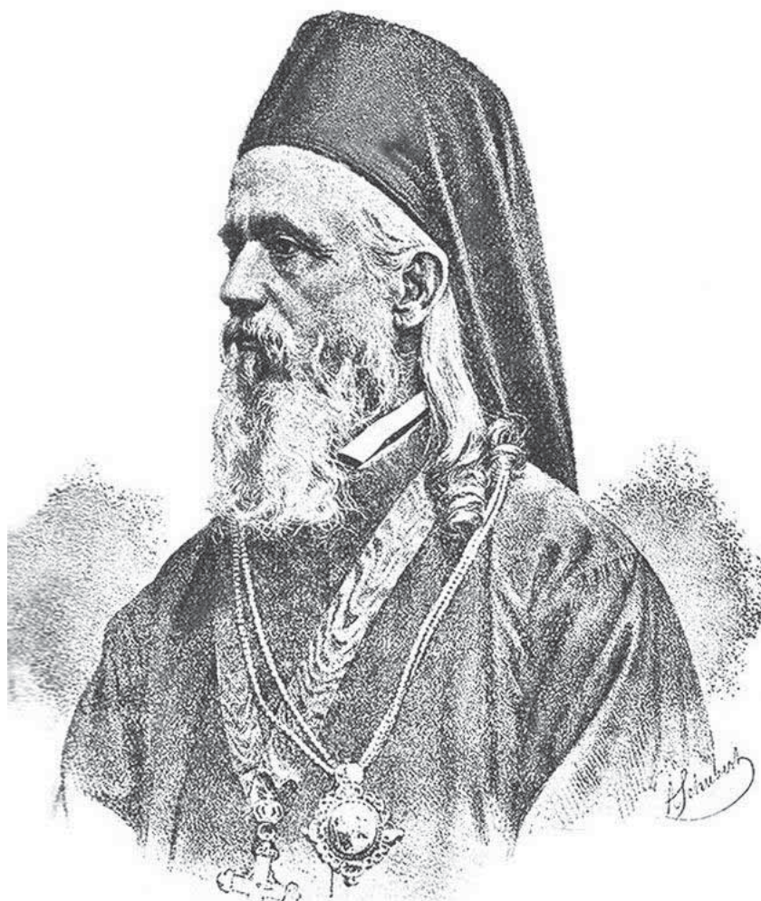
Мал. 7. Митрополит Сільвестр Мораріу-Андрієвич.