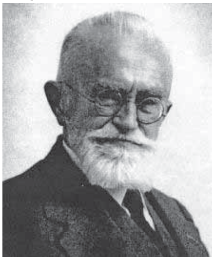
Мал. 6. Йозеф Сомбаті.

Перші археологічні колекції на Буковині налічували артефакти різних найдавніших епох – неоліту, енеоліту, палеоліту, залізної доби та епохи раннього християнства. Перші ґрунтовні публікації про археологічні знахідки на Буковині здійснили Й. Сомбаті (мал. 6), П. Райнеке, К. Ромшторфер в щорічниках крайового музею. Й. Сомбаті був першим археологом, який написав нарис з археології Буковини. Ця книга побачила світ у Відні 1899 р. [48, с. 13].