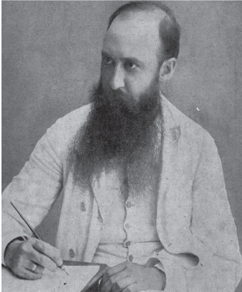
Мал. 11. Ніколай Йорга.