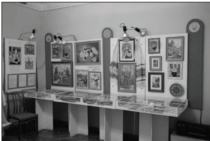
Фото 8. Виставка у відділі „Буковинська діаспора”