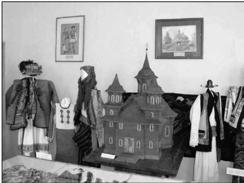
Фото 7. Виставка „Традиційний народний одяг”