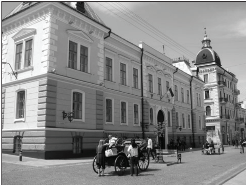
Фото 1. Краєзнавчий музей. Сучасний вигляд

сьогоднішній день відсутні. Тим не менш, деякі аспекти діяльності цього музею, як і ряду інших, що існували на терені Чернівецької області з 1945 р. й у переважній більшості працюють до нині, українські вчені все ж вивчали. Природно, що дослідницьку увагу вони, в першу чергу, зосереджували саме на діяльності Чернівецького краєзнавчого музею, найбільшого і найстарішого в області, аналізуючи історію його фундації, створення перших експозицій та організацію науково-просвітницької роботи. Серед існуючих публікацій високим рівнем інформативності позначені статті таких авторів, як Б. Тимошук [72], Б. Борвін [36], П. Ржавський [64], К. Сергієнко [68], М. Гошко [41], І. Вишневська [37], С. Воронцов [38], К. Сергійчук [70], Л. Гвіздецький [40], О. Росинська [65] та ін. У багатотомній колективній праці „Історія міст і сіл Української РСР”, у томі “Чернівецька