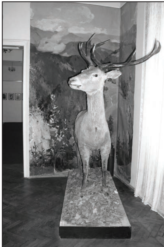
Фото 3. Виставка „Природа краю”

музейний колектив [14, с. 1]. У 2002 р. музейні працівники відновили видання „Музейного щорічника”, на сторінках якого науковці, музейники, молоді дослідники мають можливість публікувати результати своїх наукових студій та розвідок. Наприкінці 2000-х рр. співробітниками відділу археології, середніх віків і нової історії краю (завідувач відділом С. Белінська) побудовано стаціонарну експозицію „Історія краю з XIV до кінця XIX ст.” (фото 5), у 2010 р. – створено виставку „Панське місто”, яка стала родзинкою музейної експозиції (фото 6) [21, с. 9]. Протягом 2011 р. музей був партнером і об’єктом виконання заходів проекту „Підвищення туристичної привабливості та формування позитивного іміджу