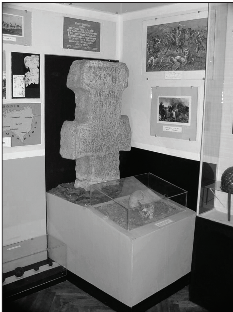
Фото 5. Фрагмент експозиції „Буковина у складі Молдавського князівства”

згідно з розпорядженням Чернівецької обласної ради за № 65 від 6 квітня 2012 р., стара назва – “Чернівецький краєзнавчий музей Управління культури обласної державної адміністрації”, була змінена на “Чернівецький обласний краєзнавчий музей”. Розпорядження набуло чинності 7 травня того ж року згідно наказу по музею за № 67-в [15, с. 75]. З метою забезпечення 346