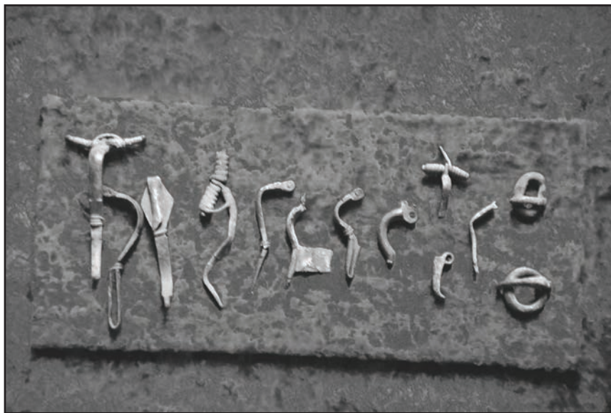
Фото 2. Фрагмент археологічної виставки

Протягом 90-х рр. ХХ – початку ХХІ ст. тематична історіографія поповнилась низкою нових публікацій, де, крім розгляду питань, пов’язаних з історичним музезнавством у регіоні, так само висвітлювалась проблематика діяльності обласного краєзнавчого музею. Зокрема, варто виділити статті