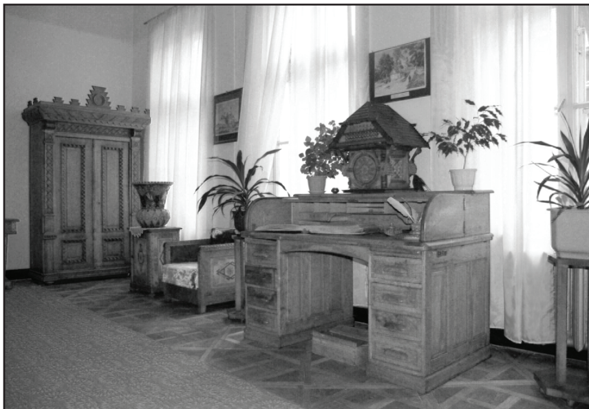
Фото 9. Експозиція „Відкриті фонди”