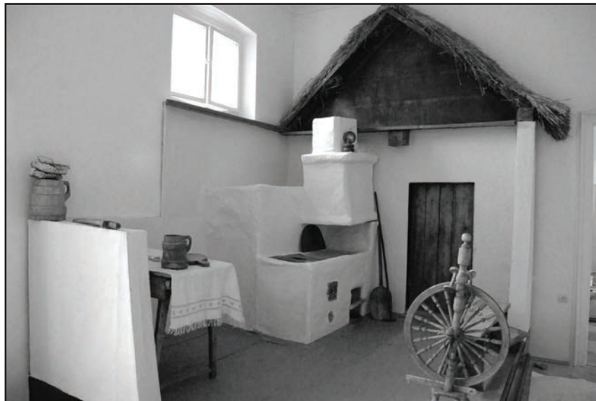
Фото 4. Інтер'єр сільської хати початку ХХ ст.

Чернівецької області через впровадження новітніх методів у музейно-краєзнавчу роботу”, розробленого і співфінансованого Чернівецькою обласною радою й Дирекцією Всеукраїнського конкурсу проектів та програм розвитку місцевого самоврядування, завдяки чому були виконані значні обсяги реставраційних і ремонтних робіт, підготовлені до монтажу експозиції вищезазначених 8-ми експозиційних зал. Для них було придбано музейне експедиційне обладнання. Необхідно також підкреслити, що завдяки цьому проекту відвідувачі музею мають нині (на 2016 р.) можливість скористатися послугами аудіогіда українською та англійською мовами, а користувачі Інтернету отримали доступ до „Музейно-туристичного порталу”, де представлена інформація про музей, його відділи та філії, матеріали експозиції (фото й відеоекскурсії), відомості про історичні місця й природні заповідники області [15, с. 99]. Варто також зазначити, що цей музейний заклад протягом усього періоду свого існування декілька разів змінював назву – як у радянську добу, так і за часів незалежної України. Зокрема,