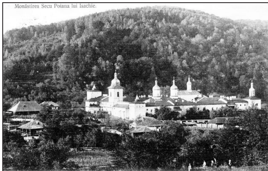
Мал. 3. Монастир Секу

Єрусалиму, Патмосу, Епіру, святих гір Синаю і Афону стала передача воєводами у їхню власність багатих молдавських монастирів. Ця практика набула поширення у XVI – першій половині XIX ст. Аналізуючи питання молитовних обителів в контексті дослідження секуляризації володінь східних монастирів й церков на території Валахії та Молдавії, російська дослідниця Л. Герд вказувала на те, що впродовж XVII – XVIII ст. молдавські господарі та члени знатних молдавських родів робили пожертвини тільки місцевим монастирям, але грецьким монастирським обителям ряду областей християнського Сходу. Для матеріального забезпечення східних монастирів вони передавали у власність цим обителям, а також Святому Гробу, Александрійському та Антіохійському патріархатам обширні земельні володіння, які складали близько 1/4 території Молдавії та Валахії [28, с. 8]. Причину появи на теренах Молдавії преклонених монастирів автор „Опису Молдавії” екс-господар Димитрій Кантемир пов’язував із прагненням молдавських воєвод забезпечити місцеві монастирі, якими вони опікувалися, від руйнувань після їх смерті або ж занепаду. З цієї метою ці обителі присвячували одній із великих лавр,