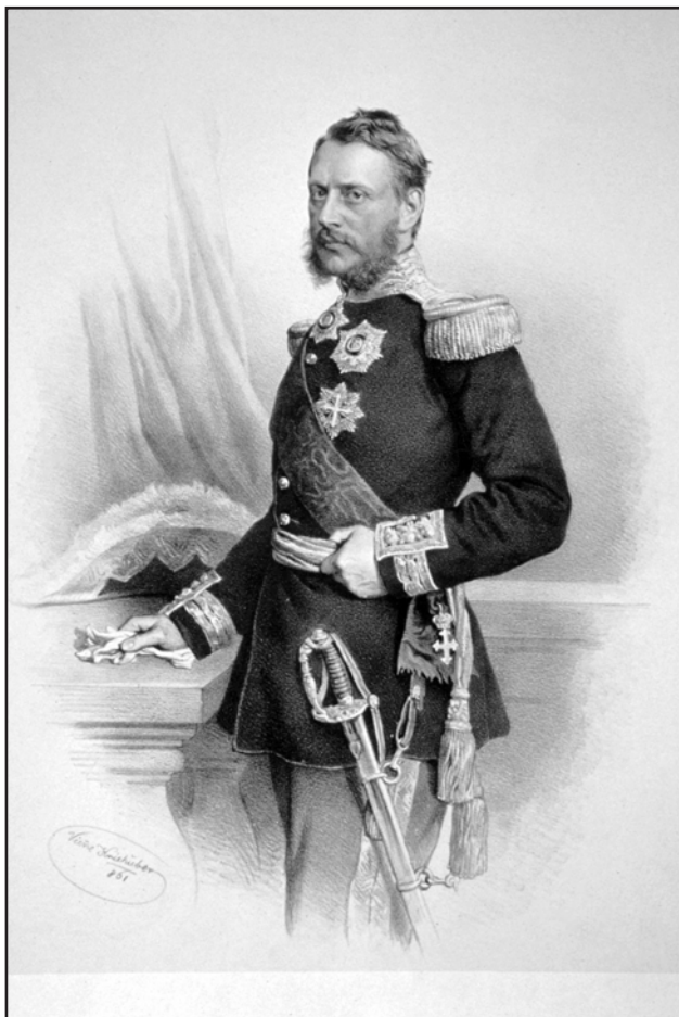
Мал 7. Воєвода Александр Іоанн Куза (худ. Кріхубер)

Таким чином, підводячи підсумки щодо означеного питання, можна констатувати, що у XV – середині XIX ст., коли Молдавська земля перебувала у васальній залежності від Османської імперії, світська влада в особі господаря потребувала сильного союзника в питаннях внутрішнього управління; такого союзника, котрий своїм авторитетом зміг би стати її опорою в державній політиці. Не викликає сумнівів, що в доіндустріальному суспільстві, такою опорою могла стати