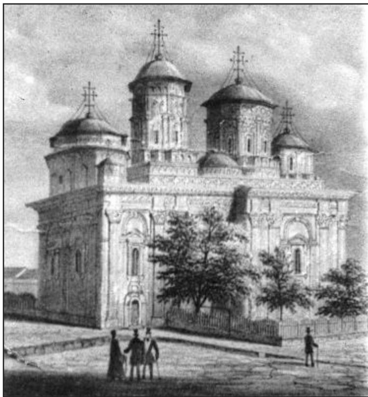
Мал. 5. Монастир Голя в Яссах

Поява молитовних монастирів припала на XVI ст., проте, як стверджував Ф. Курганов, з документальною достовірністю про їх появу на території Молдавії можна говорити лише на рубежі XVI – XVII ст. Так, монастир Ксеропотам, заснований Нестором Уреке в 1599 р., посвячений Грецькому Афонському однойменному монастирю. Монастир Голя, заснований