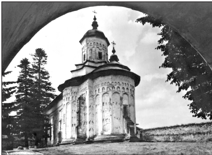
Мал. 2. Монастир Пробота

Так само хай перебувають у спокої ті кріпаки того монастиря відносно панщини, возової повинності, тягловими кіньми, [сплати соляного податку; ні чернівецькі старости, або дешугубінари, або глобники, щоб не шукали приводу увійти