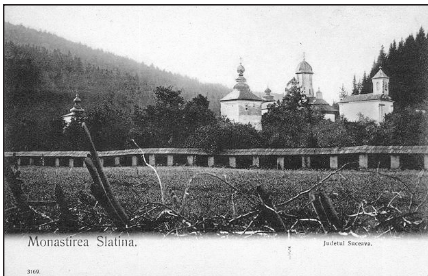
Мал. 4. Монастир Слатина

які, відповідно, знаходилися в Єрусалимі, на горі Синай чи Святій горі Афон [16, с. 280]. Відомий російський дослідник Ф. Курганов теж дотримувався цієї думки, відзначаючи: „З усіх цих фактів безсумнівно те, що присвячені монастирі при місцевих господарях Молдавії і виникненням своїм, і походженням зобов'язані благочестивим їхнім почуттям, їх релігійності та піклуванню про православну віру” [31, с. 141]. Крім молдавських господарів, у якості жертводавців матеріальних благ молотивним монастирям виступали також молдавські боярські родини. За твердженням Ф. Курганова, „бояри, у свою чергу, вмираючи, також зазвичай заповідали певну частину своїх маєтків в повне і вічне володіння християнським святиням та обителям, які знаходилися в країнах, повністю зайнятих невірними, і піддавалися більше за інших розоренню і гнобленню, тож потребували допомоги...” [31, с. 143-144]. Цікавим, щодо згаданого питання, є свідчення інока Парфенія (Агеєва), який, подорожуючи на Афон через Молдавське князівство, звернув увагу на обширні монастирські володіння у цій землі, зауважуючи, що ”вільної землі в Молдавії немає, вона або господська, або монастирська” [18, с. 147].