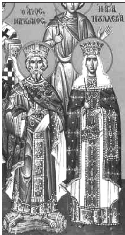
Мал. 7. Візантійський імператор Маркіан Флавій та його дружина Августа Пульхерія. Сучасна грецька ікона (XX ст.)

(чиновником Флавієм Бассом Геркуланом – Я.Я. ), престол же їй не може дістатись, оскільки верховна влада у римлян належить чоловічій, а не жіночій статі. Східний імператор оголосив, що він не зобов'язаний платити призначеної Феодосієм данини, і якщо Аттіла буде залишатися у спокої, то він вишле йому дари, але якщо буде погрожувати війною, то виведе силу, яка не поступиться його силі. Після таких відповідей Аттіла був у нерішучості й розмірковував, на яку з двох держав напасти. Нарешті він вирішив розв'язати війною клубок суперечностей на Заході, де повинен був битися не лише з італійцями, а й з