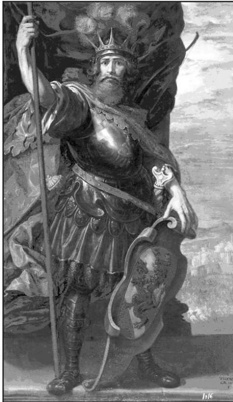
Мал. 3. Король вестготів Атаульф. Картина італійського художника XVII ст. В. Кардучіо

В умовах розколу військової верхівки Заходу вирішальну роль почав відігравати східний двір Феодосія II Молодшого. Легатів Іоанна, які прибули з пропозицією його визнати,