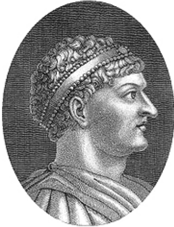
Мал. 2. Римський барельєф із зображенням імператора Заходу Гонорія

одинадцятий раз, а Констанцій вдруге (417 р.), вони вирішили справу із заміжжям Плацидії. Вона вперто не погоджувалась на шлюб і налаштувала проти Констанція усіх своїх слуг. Тим не менш, у день вступу свого в консульство імператор Гонорій, її брат, силоміць узяв її за руку і вручив Констанцію. Шлюб було відсвятковано найрозкішніше” [9, Фг. 16, р. 58]. Не менш амбітним виявився і Констанцій: 8 лютого 421 р. він оголосив себе Августом – на рівні з Гонорієм ( Мал.2 ) [13, I (III), 11.11], але 2 вересня того ж року раптово помер. Галла Плацидія доклала