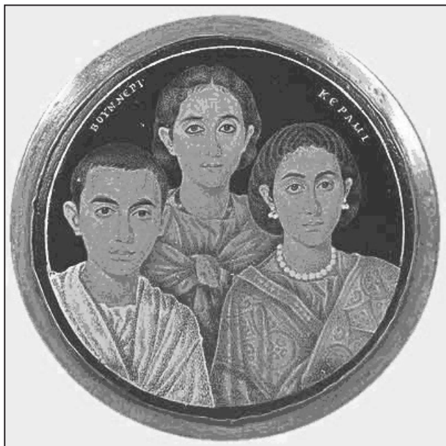
Мал. 1. Елія Галла Плацидія (в центрі) зі своїми дітьми – майбутнім імператором Валентиніаном III та Юстою Гратою Гонорією. Зображення на „Брешийському медальйоні”

Джерела загалом зберегли мало прямих свідчень, які дозволяють реконструювати основні події його біографії, оскільки цей західноримський монарх завжди залишався в тіні своєї матері й „останнього римлянина” Аеція. Валентиніан III народився 2 липня 419 р. у Равенні. Для батьків – першого консула і майбутнього імператора Констанція III й Елії Галли Плацидії (Мал. 1), доньки Феодосія I Великого (379-395), він став другою дитиною в родині. Тогочасний імператор Заходу Гонорій (395-423) залишався бездітним, і за даних обставин мав не дуже приязні стосунки зі своєю зведеною сестрою, амбітною Плацидією, хоча 417 р. власноруч організував її шлюб з цим талановитим, перспективним полководцем. Означену подію описують Прокопій Кесарійський [13, I (III), 11.9], Павло Орозій [11, VII, 33.10] і Олімпіодор Фіванський. Останній, наприклад, констатує: „Коли імператор Гонорій отримав консульство в