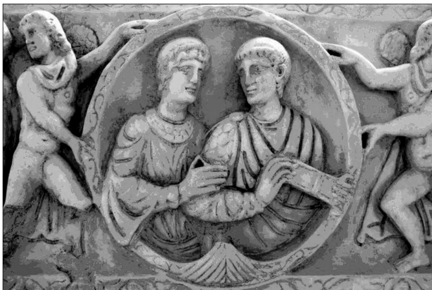
Мал. 4. „Останні римляни” Аецій та Боніфацій – полководці й головнокомандувачі Валентиніана III. Римський барельєф V ст.

сина, і характер цього недостойного імператора поступово виправдав підозру, що Плацидія розслабила його юність, привчаючи його до моральної розбещеності й старанно відволікаючи його увагу від усіляких благородних та чесних занять. При загальному занепаді войовничого духу її арміями командували два полководці – Аецій і Боніфацій, які достойні назви останніх римлян (Мал. 4). Їхня достойність могла би підтримати імперію, що розвалювалась; їхні чвари виявились пагубною й безпосередньою причиною втрати Африки (...). Таланти Аеція та Боніфація могли би бути з користю застосовані