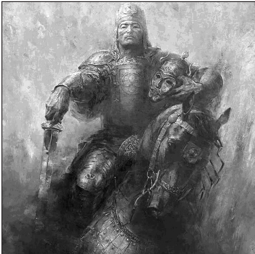
Мал. 5. Аттіла – володар гунів. Сучасний малюнок

для Аттіли, як виявилось у подальшому, не стали до кінця прогнозованими та сприятливими. Вагання і остаточний інвазійний вибір гунського керманіча відіграли роль лише межового етапу, який, зрештою, трансформував і спрямував пріоритети варварського та греко-римського світів в русло етноцивілізаційного синтезу. Перший період Великого переселення народів добігав кінця; його вирішальну фазу передвизначив саме Аттіла.