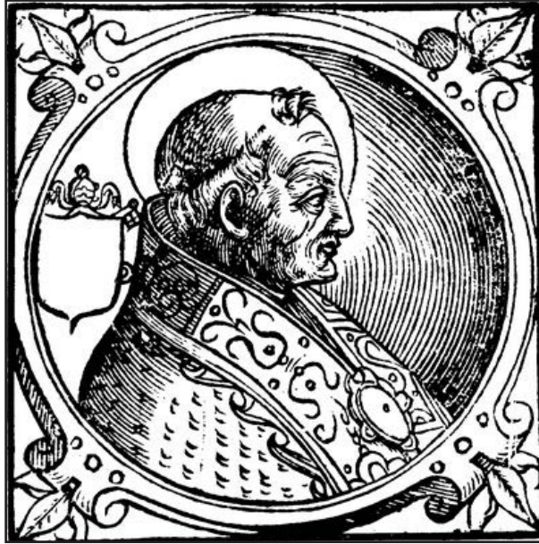
Мал. 5. Папа Григорій I Великий. Італійська книжкова гравюра 1600 р.

котрої бачило V століття. Однак невдовзі, ще в юному віці (у неповних 14 років) знехтувавши науковими заняттями, він втік від світських спокус та розваг, яких особливо багато зосередилось у Вічному місті, спочатку до Абруцци, звідти до Еффіди, надалі – в Сабінські гори, у дику відлюдну місцевість Субіако, біля річки Тевдоне (неподалік від Аньо, де вона впадає до Тибру) [10, с. 210].