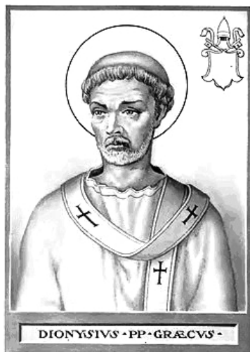
Мал. 2. Римський понтифік Діонісій. Іконографічне зображення XIX ст.

[13, с. 62]. Однак процес загального посилення і централізації папської влади сконцентрувався в руках римських єпископів-первосвящеників; він поступово набрав силу й зупинити його було вже неможливо. Цьому посиленню сприяла низка причин: інвективи та гоніння, спрямовані переважно проти „пастирів Церкви”; право гріховідпущення, знов підтверджене і визнане за єпископами внаслідок перемоги над монтанізмом; право християнської общини володіти майном, котре за римським законодавством належало не всій спільноті в цілому, а лише