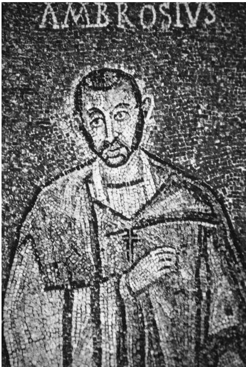
Мал. 4. Св. Амвросій, єпископ Медіоланський. Римська мозаїка VI ст.