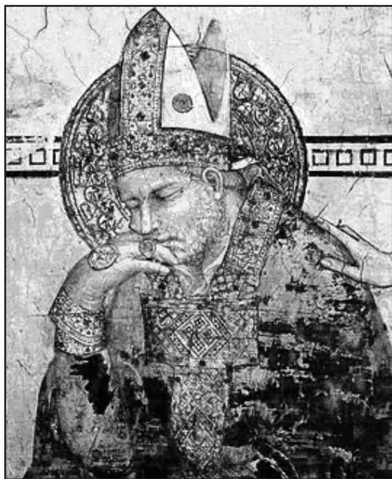
Мал. 3. Св. Мартін, єпископ Турський. Італійська фреска XVI ст.

специфіки позначився тим, що чернецтво Заходу стало засобом тиску і своєрідним каталізатором у боротьбі між папською теократією й світською королівською владою за інвеституру [30, с. 47]. Вплив східного чернецтва досить швидко поширився на Заході, де на початку IV ст. помітно зросли радикалізовані аскетичні настрої [45, с. 43]. Такі видатні апологети аскетизму, як Св. Афанасій Александрійський (295-373) [18, с. 56], єпископ Павло Антіохійський (313-387), блаж. Єронім Стридонський (340-420), відвідували Рим і надихали своїх західних братів прикладом східних подвижників-ентузіастів [24, с. 25-26]. Захоплені новим ідеалом, багато хто з християн Заходу попервах переселялись до Єгипта та Палестини, де жили, наслідуючи численним єремітським взірцям, але невдовзі осередки „пустельномешканства” почали виникати і на теренах Західної Європи [23, с. 96]. Загальне становлення