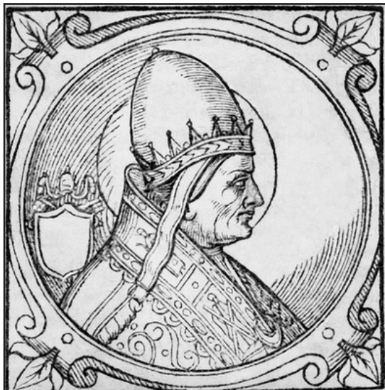
Мал. 8. Папа Боніфачій IV. Італійська книжкова гравюра 1600 р.

давньогрецького християнського богослов'я і набутоків античної культури в монастирських школах за допомогою книг, складених ними самими [19, с. 81]. „Cruce et aratro” („Хрестом та оралом”) – ось під яким гаслом бенедиктинці здійснювали свої духовні та економічні завоювання. Великих досягнень зазнала монте-кассінська обитель за правління блискучих наступників Бенедикта – Рабана Мавра ( мал. 9 ), Боніта, Петронакса, Гізульфа, Бертарія, Алігерна та ін. [59, с. 174]. Її храм у IX-XI ст. був однією з найвеличніших споруд на території Західної Європи, конкуруючи з трьома знаменитими церквами абатства Св. Рікера і монастирським комплексом Рейхенау.