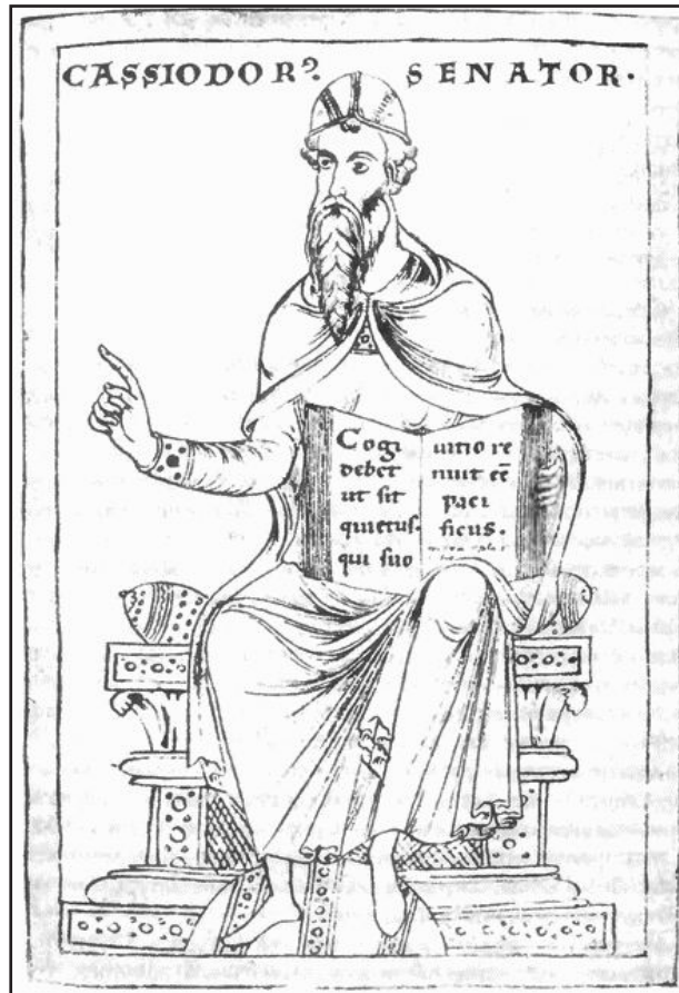
Мал. 7. Сенатор Кассіодор.

Малюнок з манускрипту IX ст., присвяченого остготському королю Теодоріху Великому.