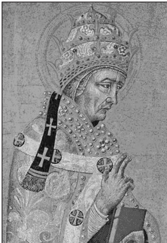
Мал. 1. Римський понтифік Фабіан. Картина Джованні ді Паоло, середина XV ст.

відповідно до адміністративного поділу міста Рима на райони, направляючи у кожную парафію по одному диякону чи піддиякону [42, с. 83]. У подальшому Папа Діонісій (259-268) ( мал. 2 ) визначив єпархії (діоцези), підвладні його митрополичій кафедрі. Цим була завершена церковна централізація Італії,