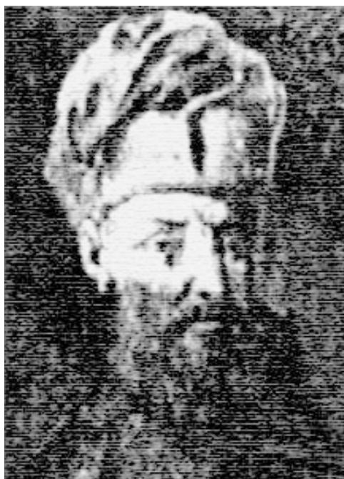
Мал. 2. Воевода Молдавії Арон Тиран.

протестантів, „православні християнські перекази ненавидів, привівши з собою іновірних радників... молебників та монастирі не любив. Срібний посуд і золото, якими були святі ікони прикрашені, від усіх монастирів до себе зібрав і себе прикрашав... від цього був плач та ридання всіх ображених і без права пограбованих” [7, с. 129]. Таке відверто вороже ставлення до Православної Церкви та секуляризація монастирського майна викликало ненависть населення країни до Іоанна Якоба Геракліда та призвело до повстання, яке закінчилося