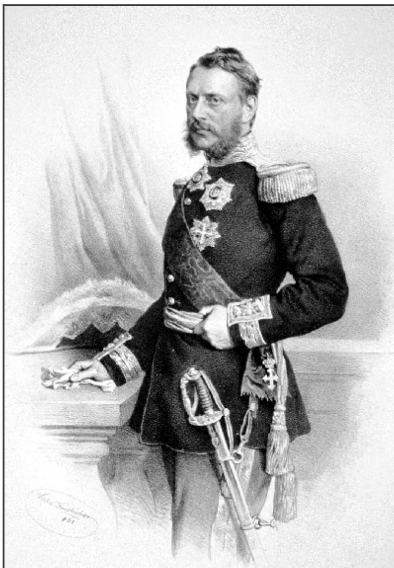
Мал. 3. Воєвода О. І. Куза (Худ. Крігубер).

Церкви в Молдавському князівстві. Ставши господарем завдяки підтримці яничар 1 та за дипломатичної підтримки англійського посла Едварда Бартона, Арон Тиран мав щодо своїх протеже певні зобов'язання, зокрема фінансового та релігійного характеру [18, с. 169; 27, с.769]. Як зазначає чернівецький дослідник О. Сич, з господаря перед його від'їздом до Ясс було взято обіцянки відновити в правах протестантів, які проживали на території