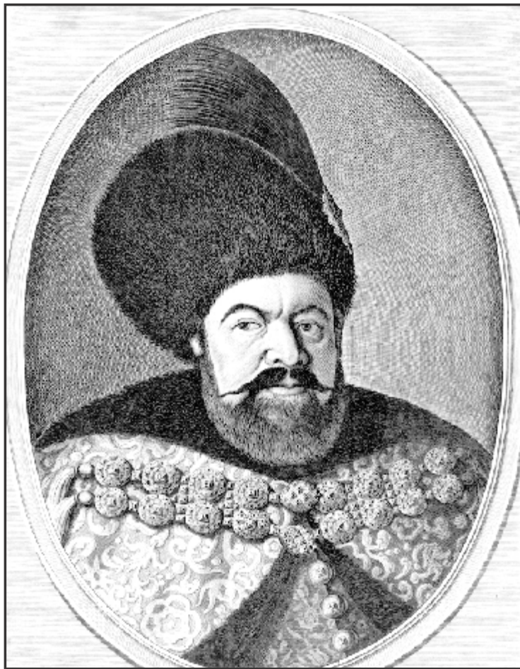
Мал. 4. Господар Молдавії Василе Лупу (Гравюра XVII ст.).

Молдавії, повернути їм церкви, забрані попередніми господарями за наполяганням єзуїтів, та дозволити свободу віросповідання [20, с. 93]. Одразу ж після зайняття молдавського престолу господар Арон взявся за виконання обіцяного в Стамбулі. Зокрема, з метою зібрання коштів для виплати боргів своїм кредиторам, в тому числі й англійському послу Бартону, він посилив фіскальний визиск молдавського населення [27, с. 770]. Крім того, воєводою було здійснено певні кроки і у справі надання релігійних свобод. Так, у листі, датованому 9 вересням 1592 р., Бартон повідомляв, що Арон „від імені її Величності відновив свободу звичаїв гуситів та передав їм церкви, які раніше їм належали” [21, с. 162]. Ці дії з боку господаря Арона Тирана викликали невдоволення молдавського православного духовенства та населення країни. До Стамбула було відправлено делегацію бояр зі скаргою на Арона та з проханням утвердити для Молдавії нового господаря Петра