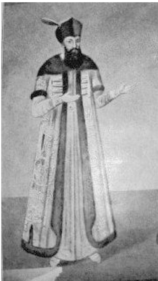
Мал. 1. Великий логофет і літописець Мирон Костін (Фреска в монастирі Тодорень).

актуалізує подальшу наукову розробку проблеми. Варто відзначити, що хоча вплив цього зовнішньополітичного чинника простежується ще з початку створення Молдавського воєводства 1 , проте тільки з першої третини XVI ст. він став особливо відчутним в державотворчій політиці Молдавії.