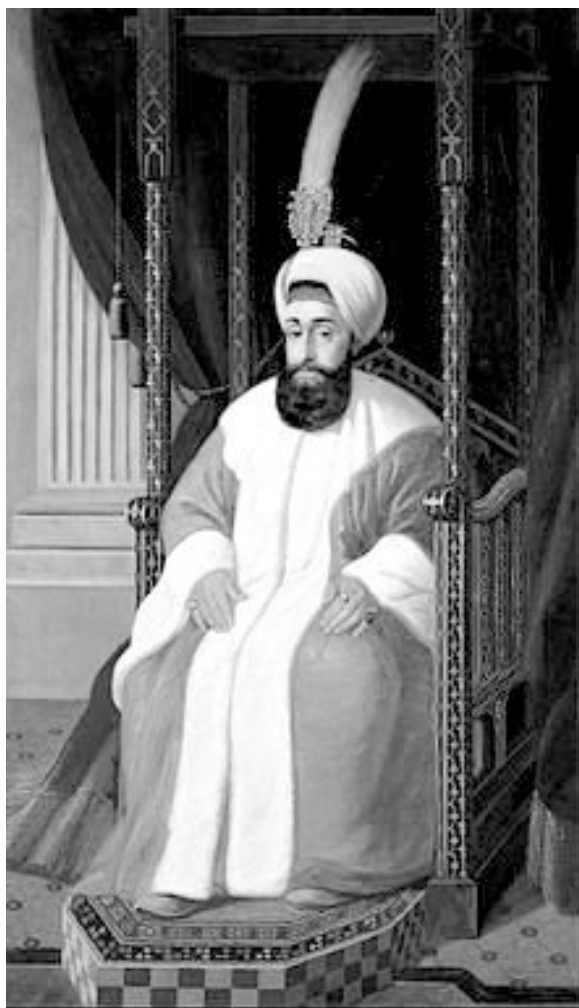
Мал. 7. Султан Селім III.

Молдавського князівства в ході російсько-турецьких війн. При цьому, вигнавши турків з Молдавії, російське військо командування встановлювало на певний період князівстві тимчасову російську адміністрацію, що суттєво позначилося на місцевих державно-церковних взаєминах. Зокрема, після завершення війни з Османською імперією (1828-1829 рр.) російською військовою адміністрацією на чолі з генералом П.Д. Кисельовим в 1832 р. було впроваджено в Молдавському князівстві „Органічний регламент” [9]. Згідно з цим актом, в князівстві передбачалося проведення адміністративних реформ,