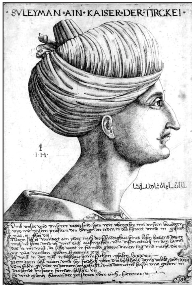
Мал. 8. Султан Сулейман I Кануні (Гравюра XVI ст.).

Кримської війни 1856 р. Маючи на меті створення кола прихильних до Франції малих держав на Балканському півострові та розраховуючи не лише на політичні, а й на економічні вигоди, французькі дипломати сприяли об'єднавчим прагненням Молдавії та Валахії. Саме підтримка вимог прихильників об'єднання в Дунайських провінціях Османської імперії, на думку сучасного українського дослідника І. Чанцова, стала першим великим зовнішньополітичним кроком по закінченні Східної війни [23, с. 91-92.]. Як результат, політичні акції Франції та Росії сприяли обранню спочатку на Молдавський, а потім на Валаський престоли полковника Олександра Іонна Кузи. Цей крок, в подальшому, заклав основи єдиної Румунської держави [17, с. 97]. Отже, проаналізовані матеріали дозволяють констатувати, що зовнішні