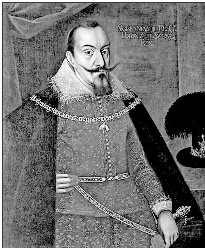
Мал. 6. Король Польщі Сигізмунд III Ваза.

III Ваза вирішив втрутитися в молдавські справи [26, с. 157]. За свідченням літописця Мирона Костіна, королівські війська „виступивши скорим походом із Землі Ляшської проти Резвана воєводи, вигнали його. І поставили від себе господарем Єремію Мовіле воєводу, наче він був обраний боярством всієї країни. І для більшої безпеки посадили у всіх фортецях ляхів служивих при зброї” [4, с. 16]. Ця зміна правителів Молдавії знайшла відображення і в османських хроніках. Сучасник подій турецький хроніст та історик Мустафа Селанікі писав, що Єремія „несподівано атакував, із своїм військом та з допомогою польського короля, невірною відступника званого Резваном, який був очільником військ проклятого Міхая, воєводи Царе