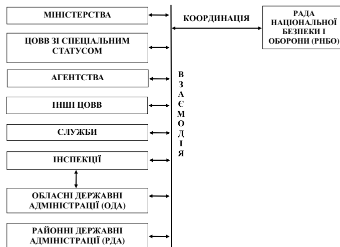
Рис. 1. Центральні органи виконавчої влади держави

Такі проблеми можна вирішити за допомогою створення адекватної системи державного управління для підвищення ефективності прийняття рішень у найкоротші терміни із забезпеченням: достовірності інформації; адекватного реагування на ситуацію; обґрунтованості прийняття рішень; налагодження взаємодії між центральними органами виконавчої влади (ЦОВВ) (рис. 1).