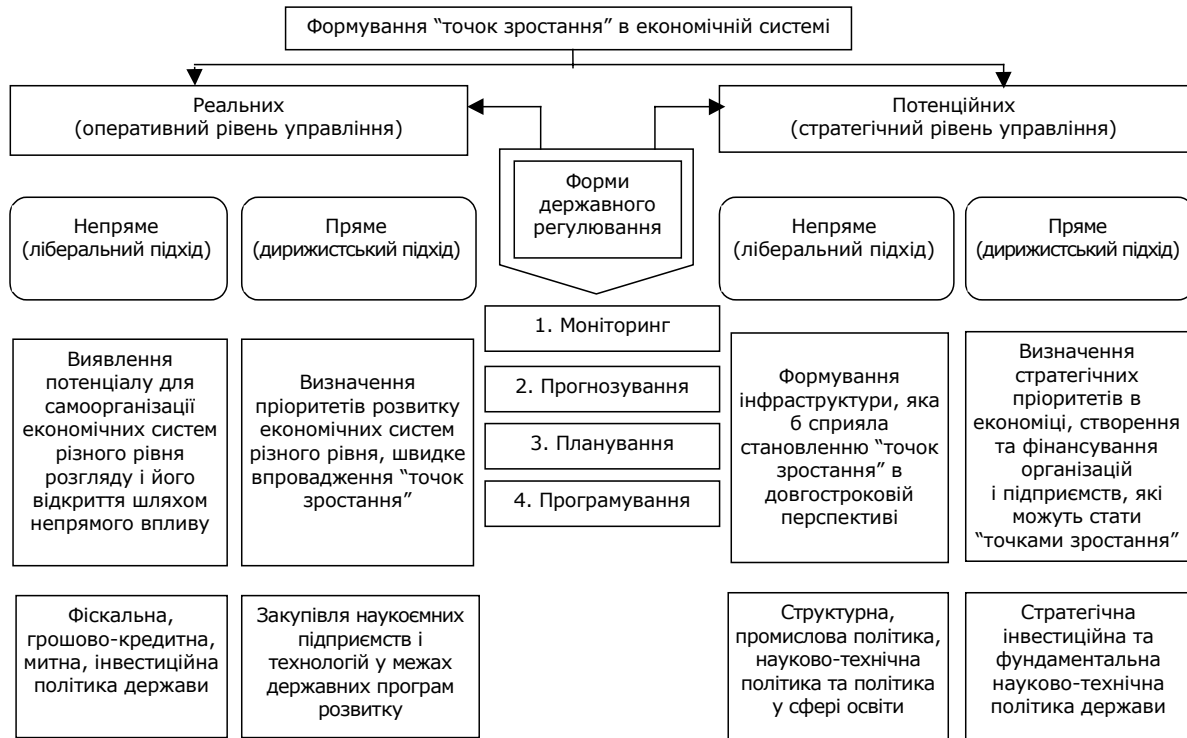
Рис. 3. Варіанти алгоритму формування "точок зростання" в економіці

Регіональний аспект дає змогу виділити регіони, у яких розвинені високотехнологічні галузі промисловості: Київська, Харківська та Львівська області України. Для решти регіонів доцільне впровадження моделей формування "точок зростання", реалізоване переважно дирижистським способом у промислових регіонах країни, і інфраструктурним – у сільськогосподарських.