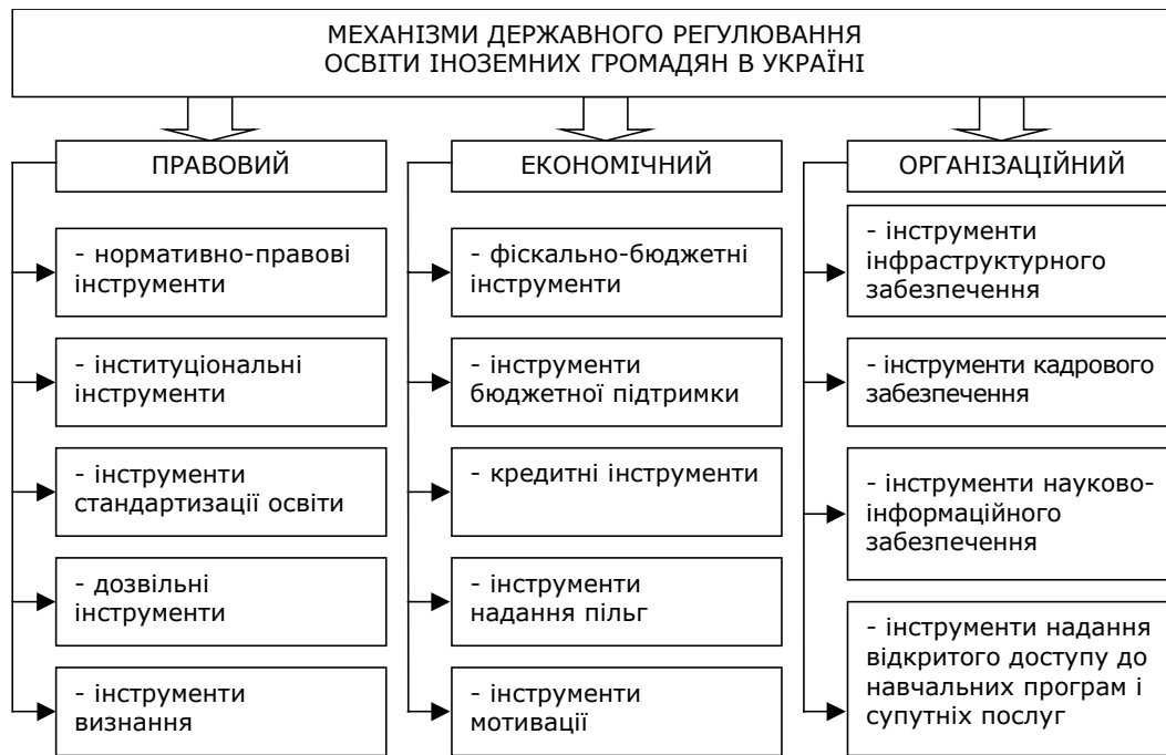
Рис. 2. Механізми та інструменти державного регулювання освіти іноземних громадян в Україні* *Складено на основі [2, с. 57].

Інструменти економічного механізму державного регулювання освіти іноземних громадян в Україні спрямовані на забезпечення фінансування доступності здобуття освіти для іноземців шляхом бюджетних та кредитних важелів або через надання пільг; створення мотиваційного поля для залучення іноземних студентів до навчання в Україні тощо.