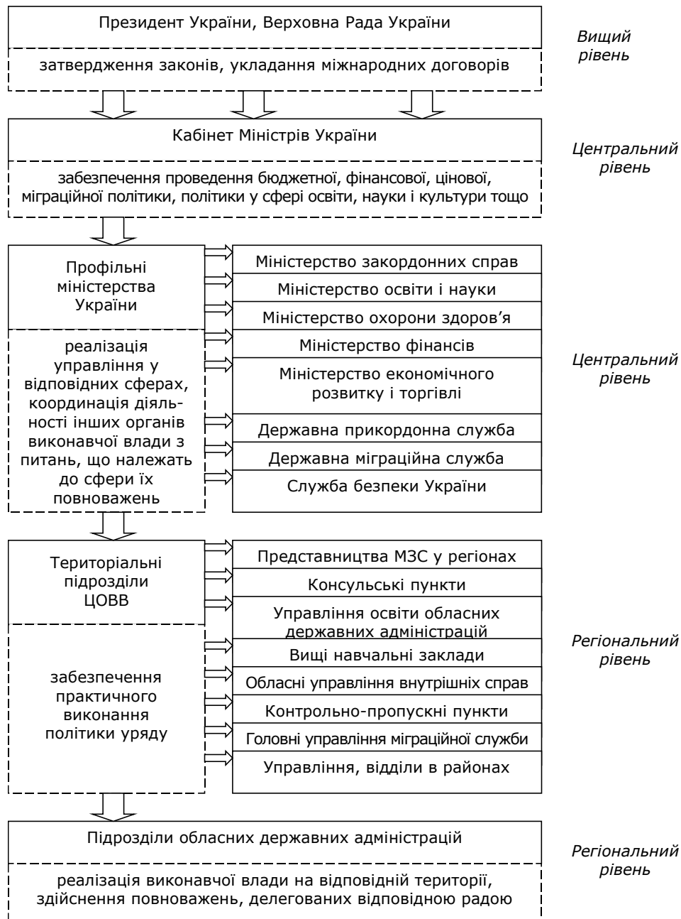
Рис. 3. Структура органів державного управління освітою іноземних громадян в Україні*