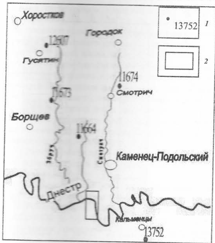
Рис. 1. Территория исследований. 1 – скважины и их номера, 2 – участок литогеохимического опробования почв

Характеристика района исследований. Территория исследований расположена в пределах Винницкой и Хмельницкой областей (рис. 1).