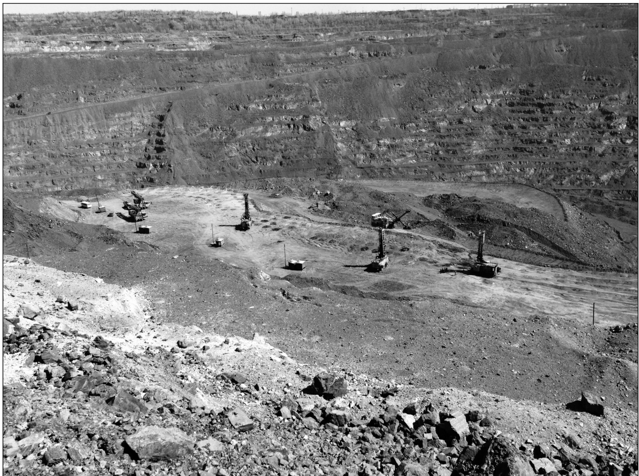
Рис. 1. Кар'єр Полтавського гірничозбагачувального комбінату