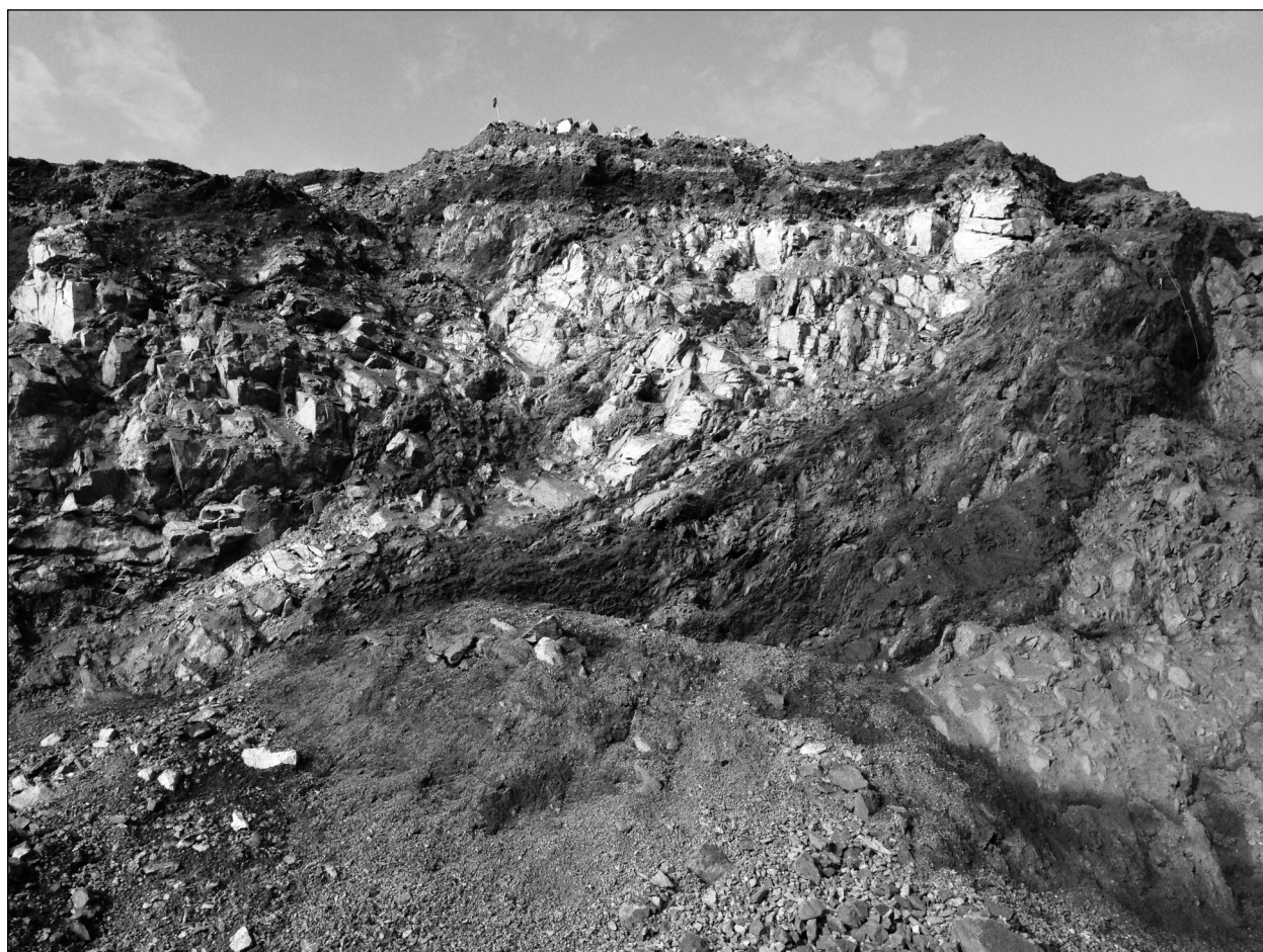
Рис. 3. Зона Головного розлому (контакт сланців з гранітоїдами AR 2sk ). Західний борт кар'єру Полтавського гірничозбагачувального комбінату