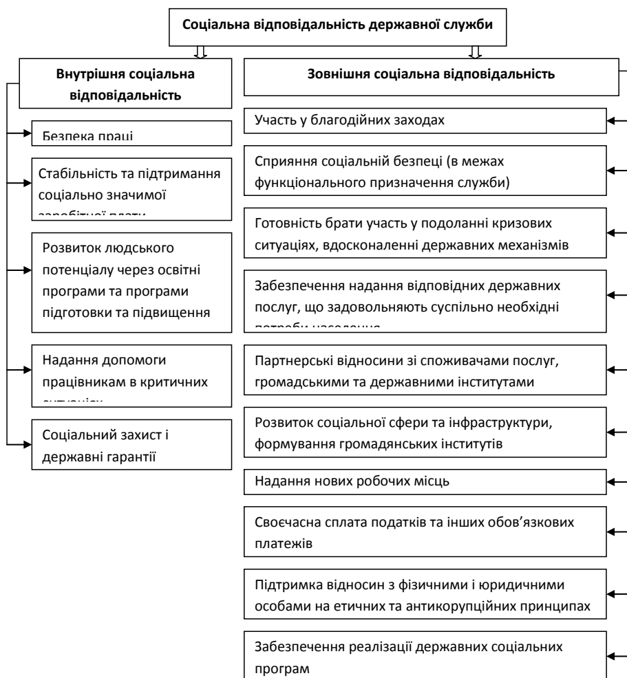
Рис. 2. Основні складові соціальної відповідальності державної служби