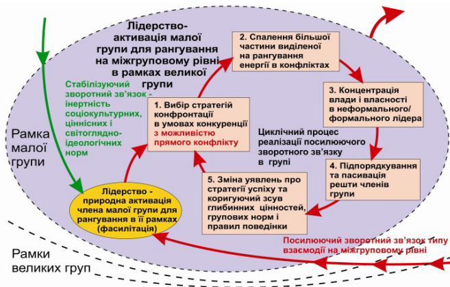
Схема 2. Структура групових процесів, що протікають при системній взаємодії учасників малих елітних груп

Як і у випадку торнадо з розподілом у ньому взаємопов'язаних різновекторних повітряних потоків, у психіці учасників елітної самоорганізаційної групи, що утворилася під впливом структуротворної ідеї, відбувається взаємообумовлений та синхронний із груповими ефектами перебіг сукупності групових процесів (схема 2).