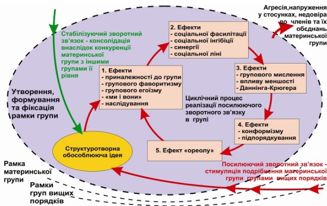
Схема 1. Структура групових ефектів, що проявляються при системній взаємодії учасників малих елітних груп

Сукупна дія цієї множини ефектів за деякий час призводить до концентрації влади у руках активної, малокомпетентної, проте самовпевненої меншості, що обумовлює прояв і поступове посилення наступної сукупності ефектів – конформізму та підпорядкування, дія яких спричинює пасивацію загалу та його готовність виконувати рішення лідерів (позиція 4, схема 1).