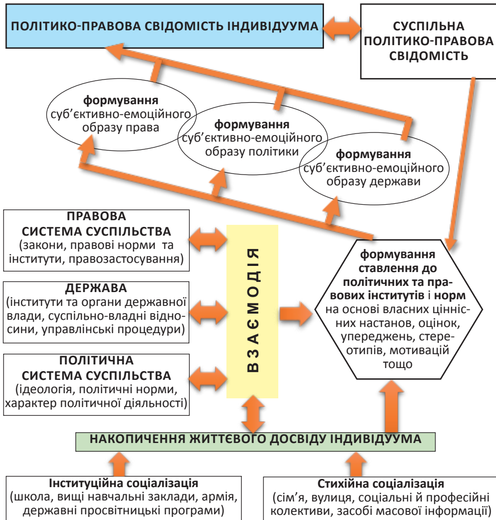
Рис. 1. Механізм формування політико-правової свідомості людини в сучасній державі

му контексті «політико-правову свідомість можна визначити як сферу суспільної чи індивідуальної свідомості, що включає знання права, розуміння політики, ставлення до права й політики, правової та політичної діяльності, відношення до суспільно-правових інститутів» [11, с. 44].