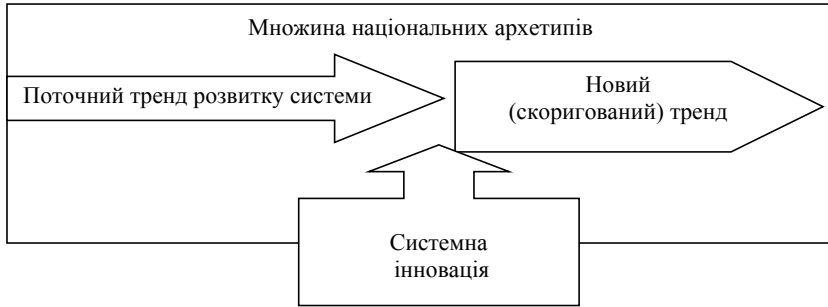
Рис. 1. Вплив системних інновацій на розвиток системи (розроблено автором)

На рис 1 показано схему впливу, виходячи зі співвідношення «традиційне – цілеспрямоване». Відповідно, чим більше системна інновація відповідатиме національній (або цивілізаційній) ідеї, що може об'єднати суспільство, тим більшою є енергія синергії, яку можна використати для побудови якісно нової держави.