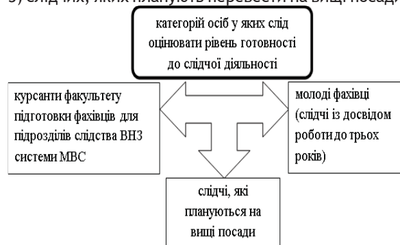
Рис. 1 Категорії осіб, в яких слід оцінювати рівень готовності до слідчої діяльності.

Ми вважаємо, оцінювання рівня готовності до слідчої діяльності необхідно здійснювати за такими напрямками [2]: