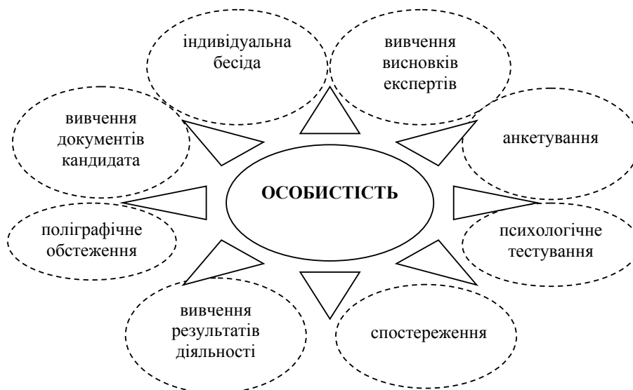
Рис. 1. Методи дослідження особистості охоронника